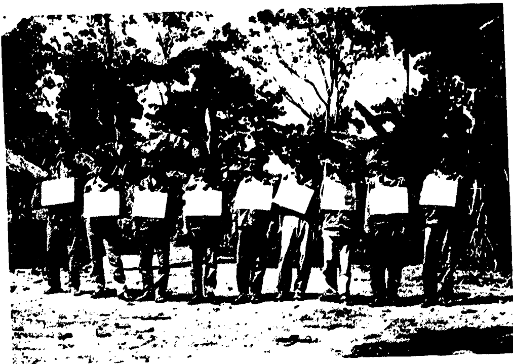
A group of 9 Vietnamese disguised soldiers captured at Bar Lang, Battambang province, on 2 November 1989