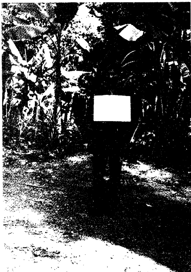
Name: TRAN VAN BINH Age : 30 years old Regiment 3 Vietnamese army Division 330