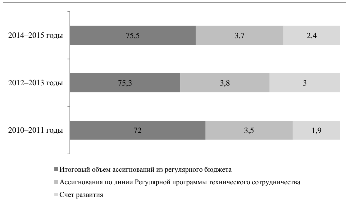
Рисунок I Двухгодичные бюджеты ЕЭК, 2010–2015 годы (В млн. долл. США)