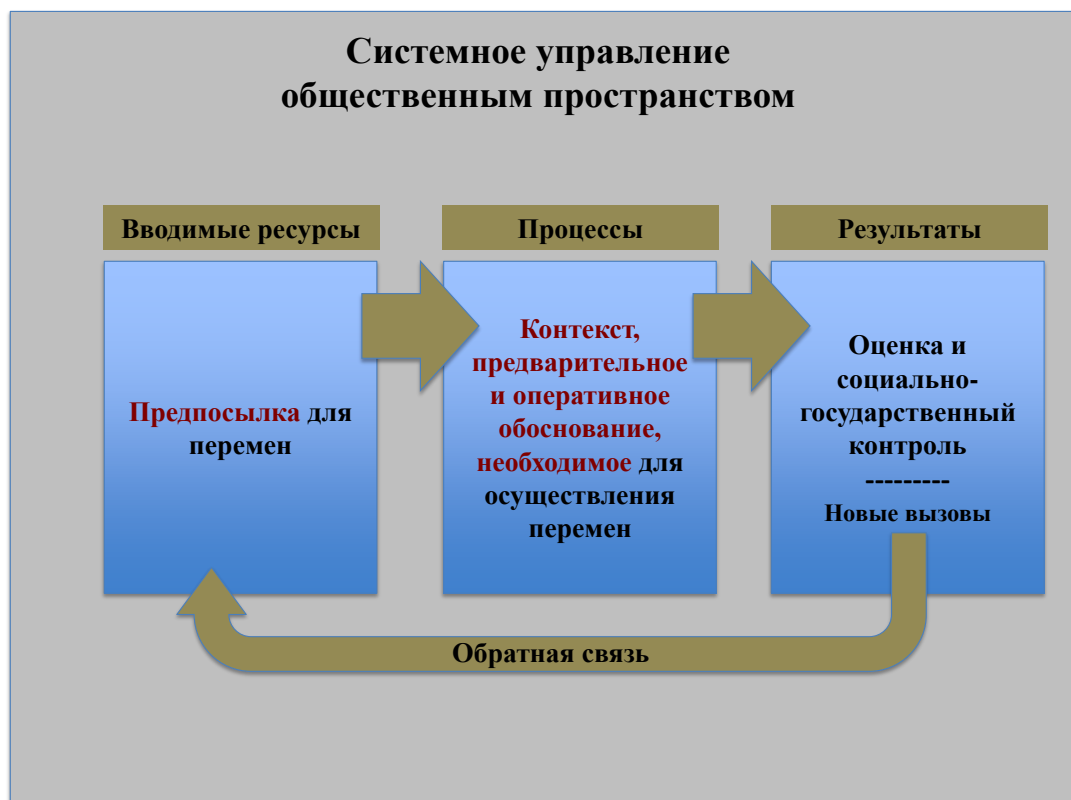
Диаграмма II Системное управление общественным пространством

11. Эта диаграмма предлагает «дорожную карту» с использованием научного метода, не отказываясь от применения творческого подхода и учета инстинктов самосохранения в области устойчивости.