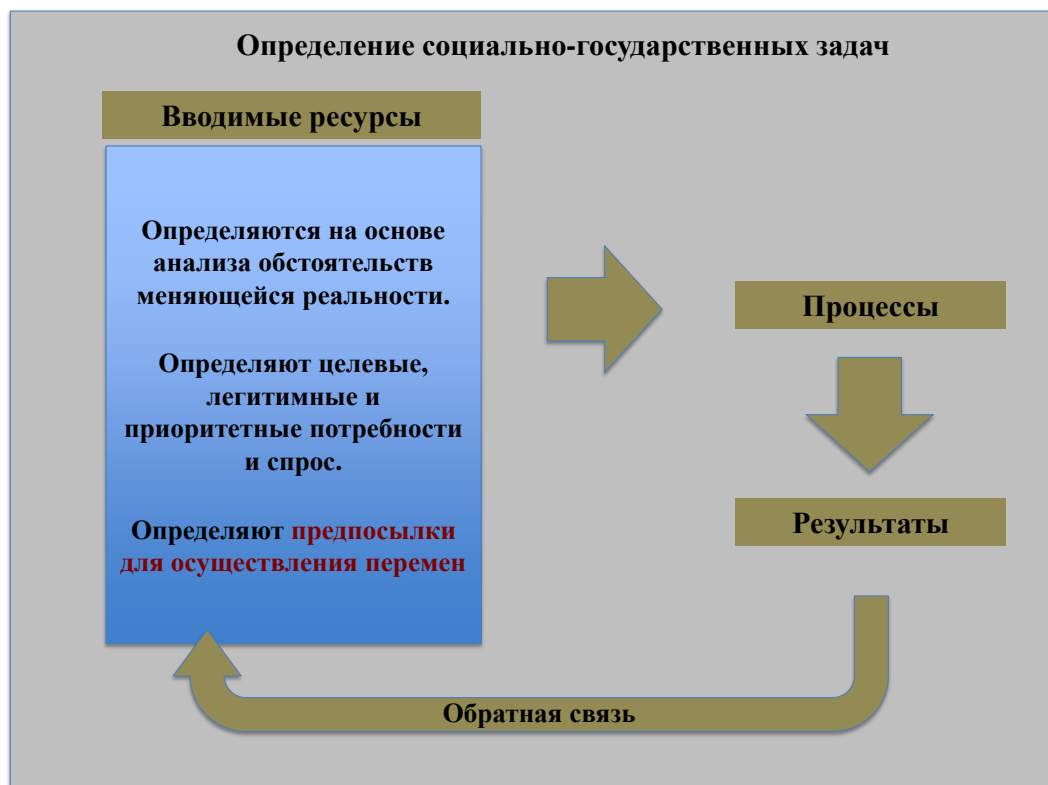
Диаграмма III Определение социально-государственных задач

14. Вводимые ресурсы — это материальные и интеллектуальные элементы, которые можно дезагрегировать для понимания причин и последствий: они должны учитываться для их дальнейшего использования; они могут изменяться или заменяться новыми компонентами, которые позволяют учитывать потребности и спрос (реальный, ощущаемый и/или создаваемый) различных социальных групп для определения вместе с ними приоритетов и действий, ведущих к переменам, которые формируют предпосылки для осуществления деятельности, причем речь идет исключительно об осуществлении государственных полномочий.