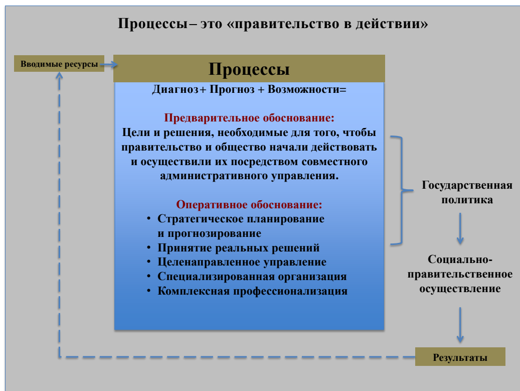
Диаграмма IV Процессы — это «правительство в действии»

16. После этого шага можно начать осуществление общего и конкретного анализа рассматриваемой ситуации, который позволит осуществить прогнозирование непосредственных и среднесрочных перспектив, осознать масштабы перемен, а также определить усилия в сфере рациональной организации, которые должны предпринять как правительство, так и общество, действующие сообща в своем стремлении реализовать общие цели.