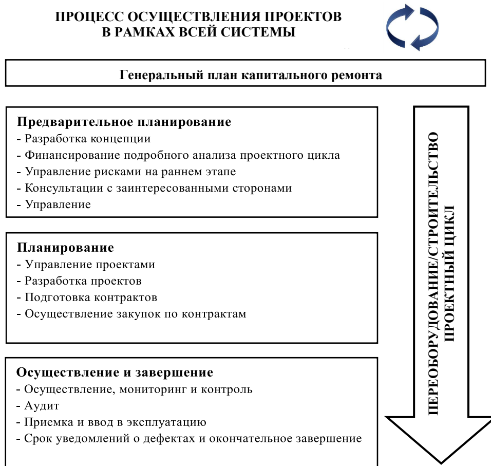
Диаграмма 1 Разработка концепции и процесс осуществления проектов капитального ремонта/переоборудования/строительства капитального ремонта/переоборудования/строительства

13. Предварительное планирование представляет собой этап подготовки проекта и документации для соответствующего представления на утверждение директивных/руководящих органов организаций.