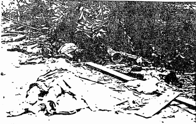
被越南炮弹炸死的两名泰国妇女和一名儿童。