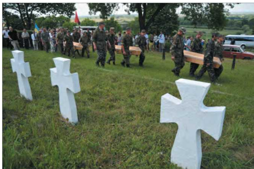
Церемония перезахоронения найденных обществом «Память» останков воинов дивизии СС «Галичина» на военном кладбище возле села Красное Золочевского района Львовской области