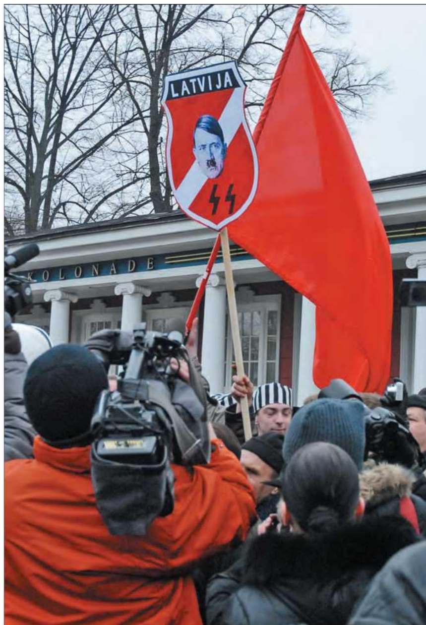
Латвия. Рига. 16 марта 2009 г. Во время шествия легионеров «Ваффен-СС» на одной из улиц города