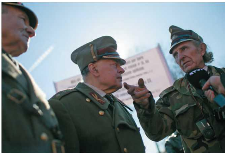
Латвия. Рига. 16 марта 2015 г. Ветераны легиона «Ваффен-СС» на шествии в центре города