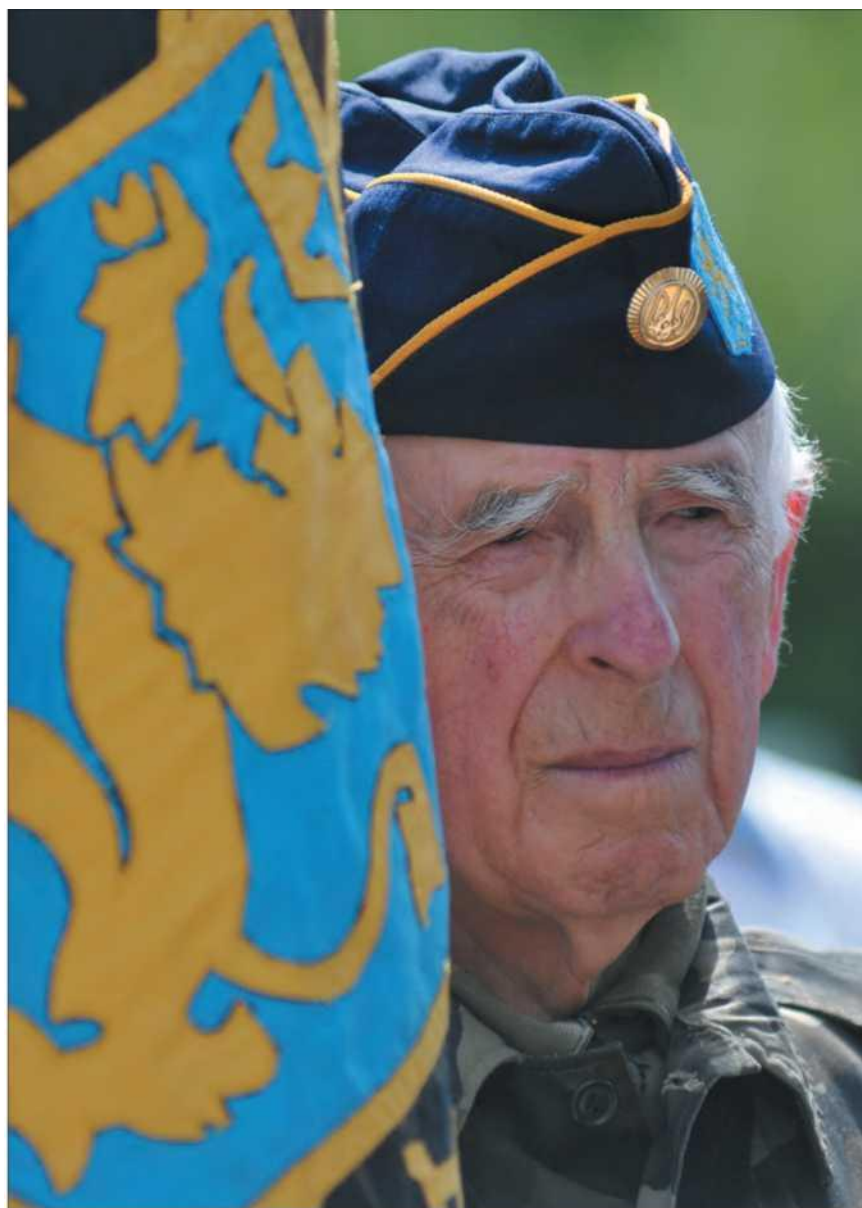
Бывший солдат дивизии СС «Галичина» на церемонии перезахоронения найденных обществом «Память» останков воинов дивизии СС «Галичина» на военном кладбище возле села Красное Золочевского района Львовской области