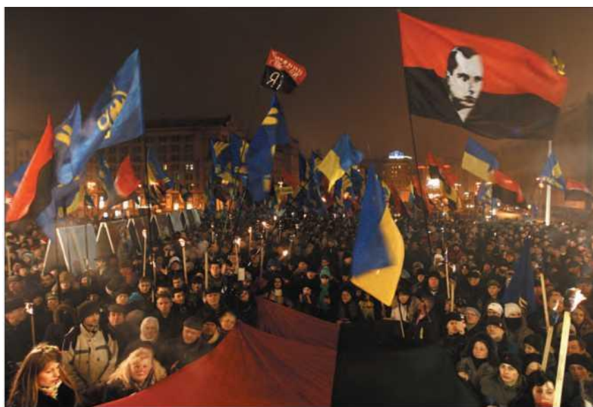
Украина. Киев. 2 января 2015 г. Участники марша в честь 106-й годовщины со дня рождения Степана Бандеры