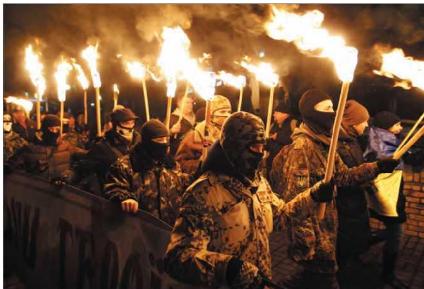
Украина. Киев. 30 января 2015 г. Участники факельного шествия, организованного украинскими националистами в честь Героев Крут