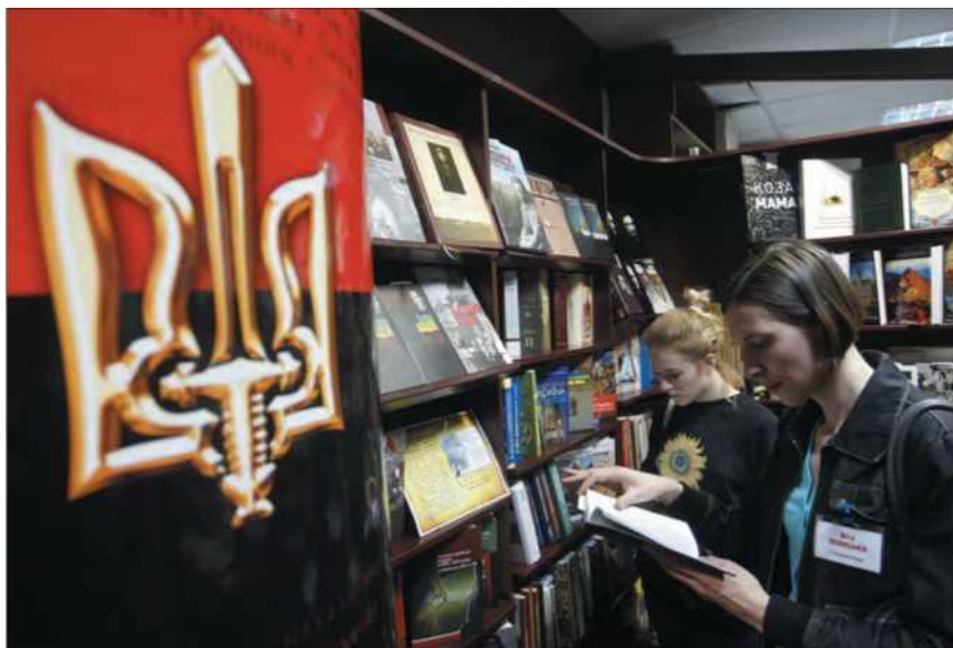
Украина. Киев. В магазине по продаже сувенирной продукции с нацистской и фашистской символикой