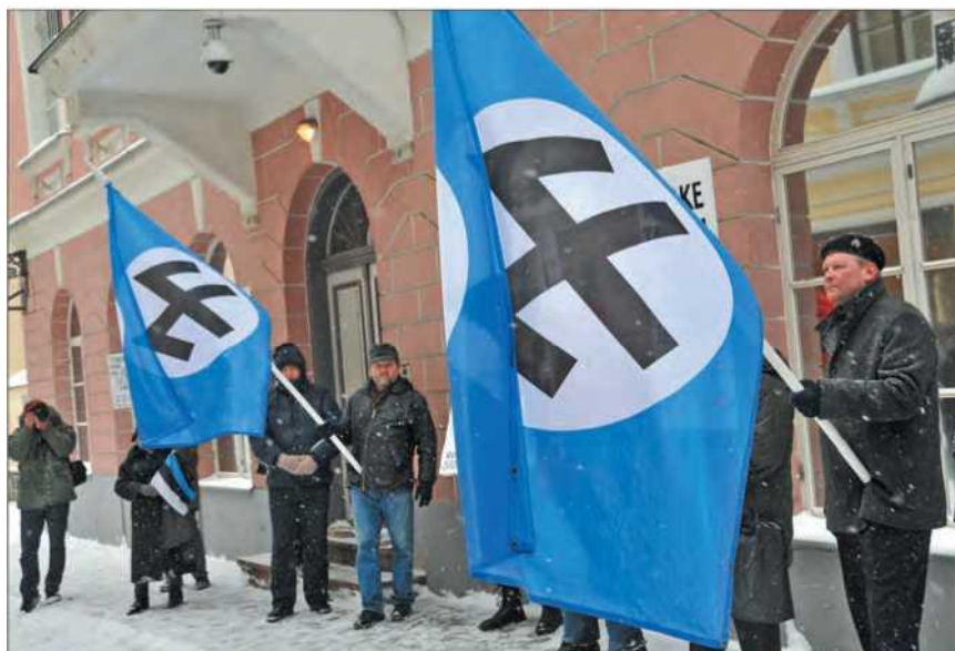
Эстония. Таллин. Участники антироссийского митинга у посольства РФ