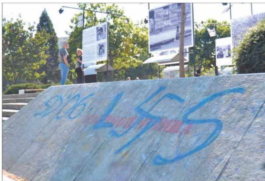
Нацистский символ на площади у Национального Дворца культуры в центре Софии