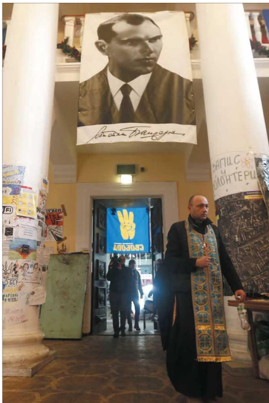
Ситуация на улицах Киева. 30 января 2014 г. Городская мэрия