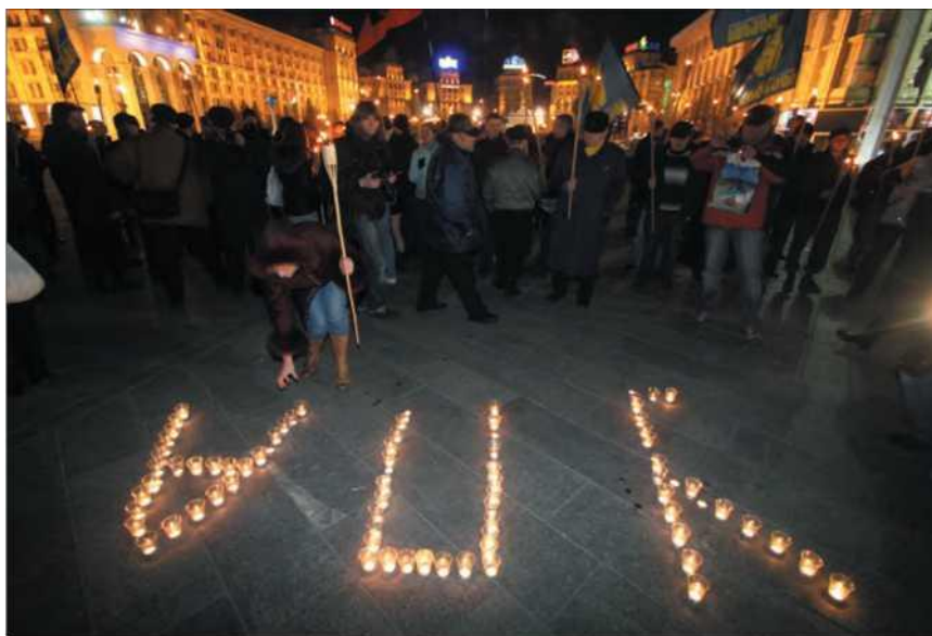
Участники факельного шествия в честь 60-летия гибели командира УПА Романа Шухевича на Майдане Незалежности