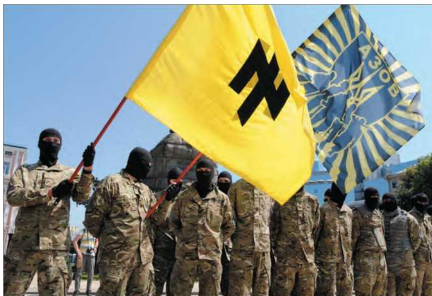
Марш в честь годовщины создания дивизии СС «Галичина» во Львове