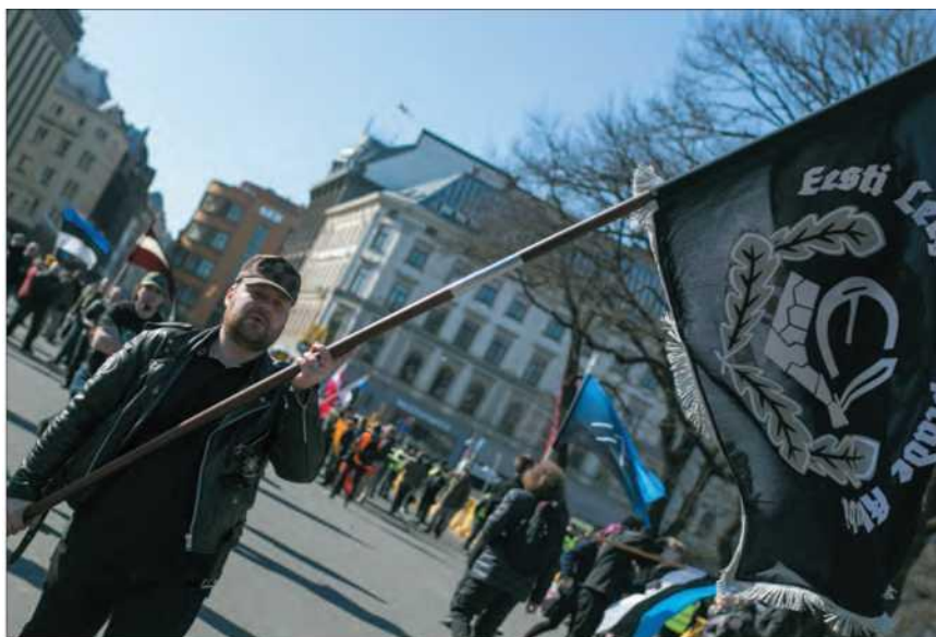
Латвия. Рига. 16 марта 2015 г. Участники шествия сторонников легионеров «Ваффен-СС» в центре города