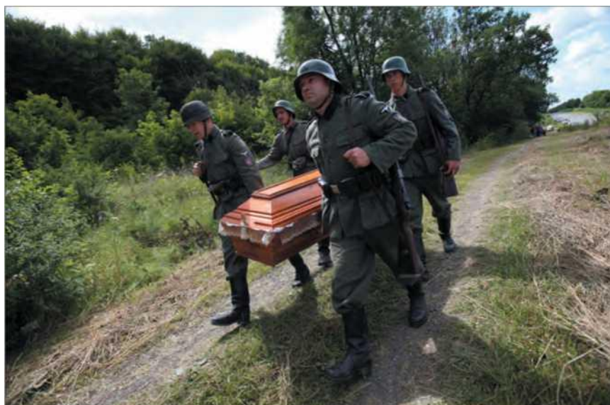
Реконструкторы принимают участие в церемонии перезахоронения останков солдат дивизии СС «Галичина» и Красной Армии возле села Червоне в Львовской области на Украине