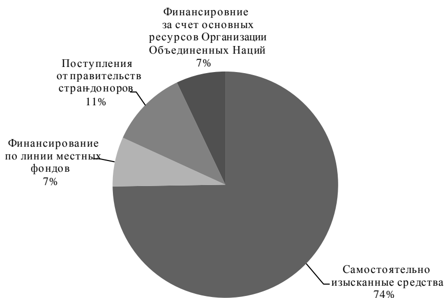
Диаграмма IV Поступления за 2014 год, в разбивке по источникам

67. Кроме того, за двухгодичный период 2013–2014 годов Германия (по линии Центра международных операций по поддержанию мира), Люксембург, Финляндии, Франции и Швейцария предоставили целевые взносы, предназначенные для конкретных видов деятельности.