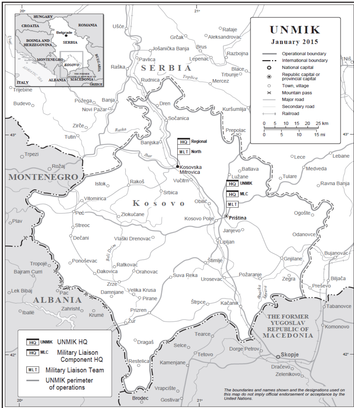
Map No. 4133 Rev. 60 UNITED NATIONS January 2015

Department of Field Support Cartographic Section