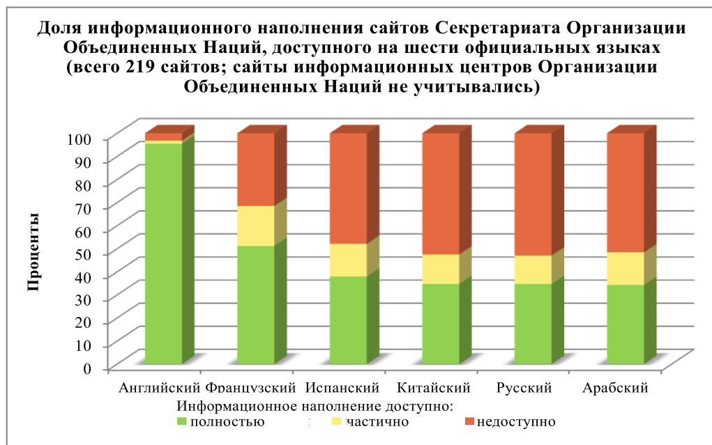
Диаграмма II Обзор положения в области многоязычия в 2014 году

Обследование также позволило определить практические решения, используемые отделениями для обеспечения того, чтобы информационное наполнение сайта было представлено на большем количестве языков. К их числу относятся соглашения с университетами.