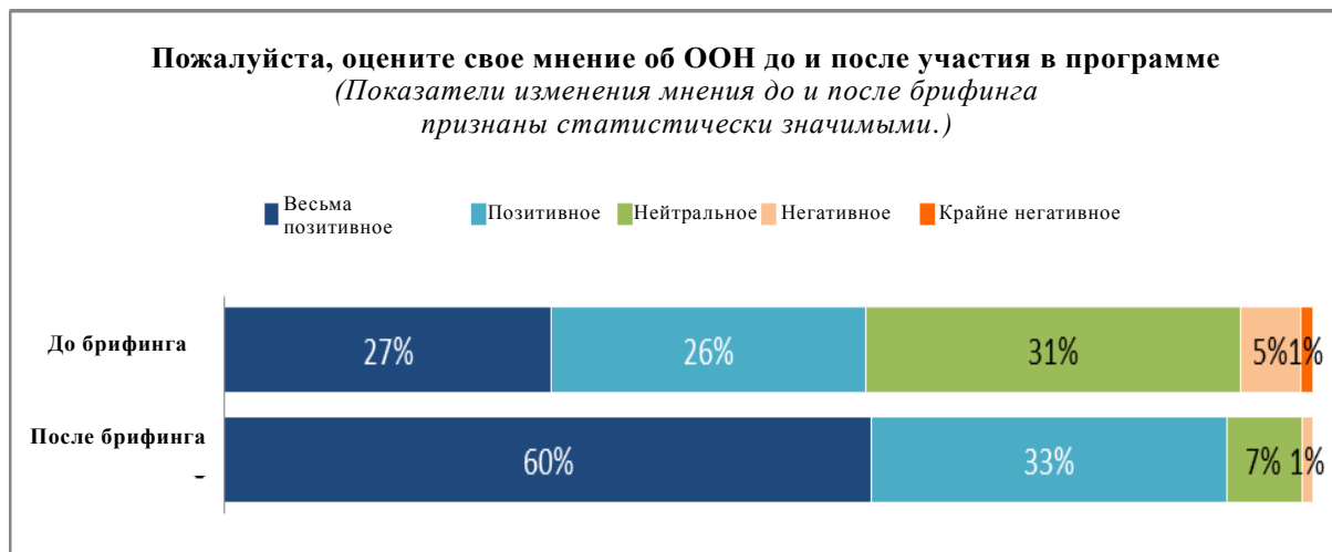
Диаграмма III Динамика мнений об Организации Объединенных Наций среди участников брифингов информационных центров Организации Объединенных Наций