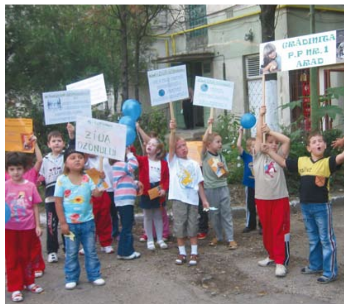
Romania's children's walk Пеший марш детей Румынии