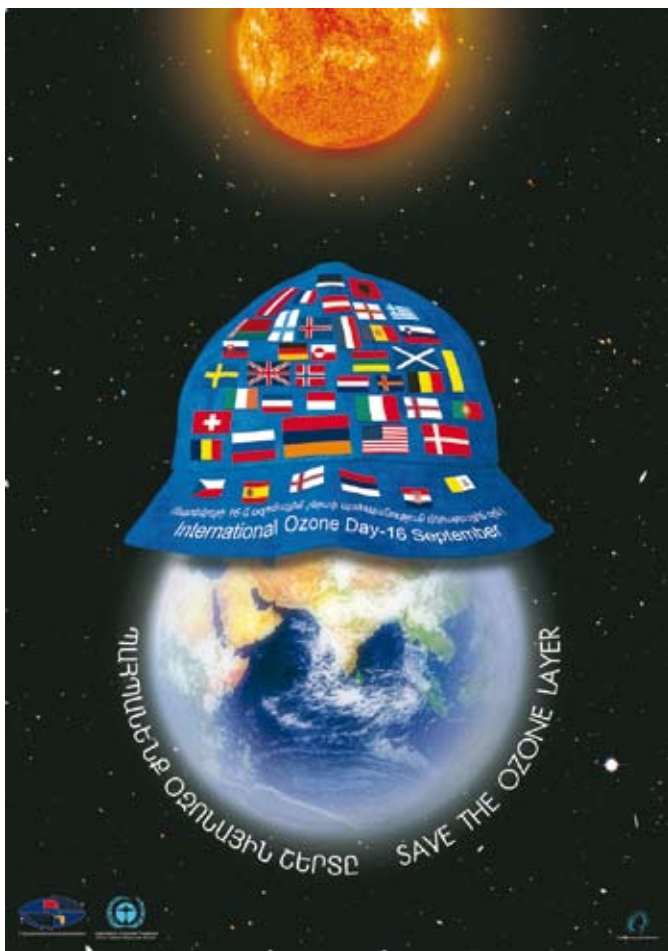
Armenia's ozone poster for the 20th anniversary of the Montreal Protocol Плакаты Армении по озону к 20-й годовщине Монреальского протокола

Одобрённые инициативы по осведомленности ...”