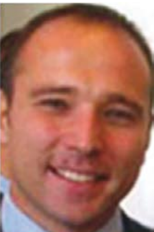
Mr. Sasa Dragin PhD, Minister of Environmental Protection Д-р Саса Драгин, Министр охраны окружающей среды.

Except for the refrigeration servicing sector, the CFC consumption is phased out in all