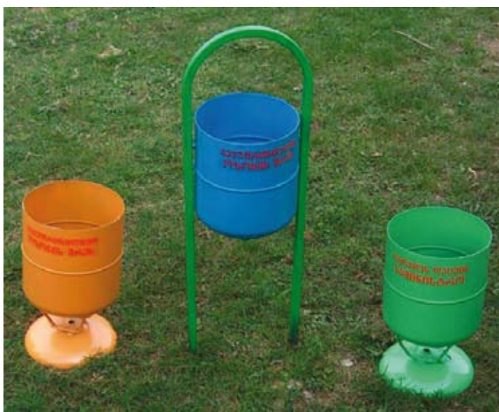
Georgia's waste bins produced from disposable cylinders Мусорные бабки, изготовленные из использованных цилиндров (Грузия)