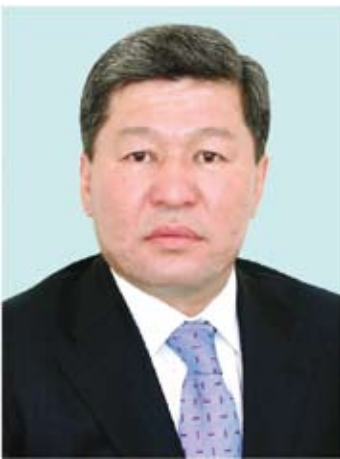
Министр охраны окружающей среды Республики Казахстан г-н Нурлан Исаков H. E. Minister Nurlan Issakov, Minister of Environment Protection of the Republic of Kazakhstan

тонн ОРС, которая являлась базовой линией. Потребление ГХФУ в 2006 г. впервые превысило базовую линию.