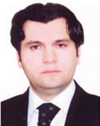
H. E. Minister Dzelil Bajrami, Ministry of Environment and Physical Planning Г-н Джелил Баджрами, Министр охраны окружающей среды

After ten years of intensive efforts to reduce and eliminate the use of ODS, and with the support provided by MLF and UNIDO, the Former Yugoslav Republic of Macedonia phased out more the 98% of its overall baseline consumption. This success story is a good example how developing countries win the battle against the use of ODS.