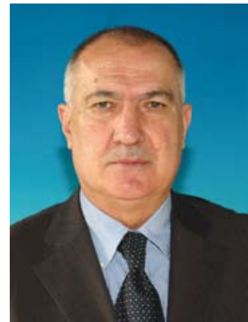
H.E. Minister Slobodan Puhalach, Ministry of Foreign Trade and Economic Relations Министр – Г-н Слободан Пухалач, Министерство внешней торговли и экономических отношений

The participation in contact group meetings of the ECA network and the exchange of experiences among Ozone Officers help Bosnia & Herzegovina to draft the ODS legislation and to start implementation of the import/export licensing system