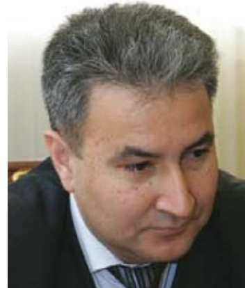
Министр охраны природы Туркменистана: Г-н Махтумкули Акмурадов Minister of Nature Protection of Turkmenistan: Mr. Makhtumkuly Akmuradov

Есть надежда, что Исполнительный Комитет пересмотрит Решение 46/21 и предоставит Туркменистану необходимую помощь для того, чтобы страна выполнила свои обязательства по положениям Монреальского протокола и поэтапно вывела из употребления ХФУ к 1.1.2010. Следует отметить, что ГЭФ недавно одобрил продление проектов ГЭФ по Институциональному Укреплению (GEF IS) для других стран с переходной экономикой, которые не были переклассифицированы как страны, действующие в рамках статьи 5, такие как Азербайджан, Казахстан, Таджикистан и Узбекистан. Эти проекты включают мероприятия, предусмотренные Заключительным планом по выводу ОРВ из употребления (TRMP), такие как обучение техников-специалистов по холодильным установкам, сотрудников таможи. Тем временем Туркменистан получил программную помощь от Региональной сети по озону для стран Европы и Центральной Азии (ЕСА) для обновления своей Программы Страны (СР).