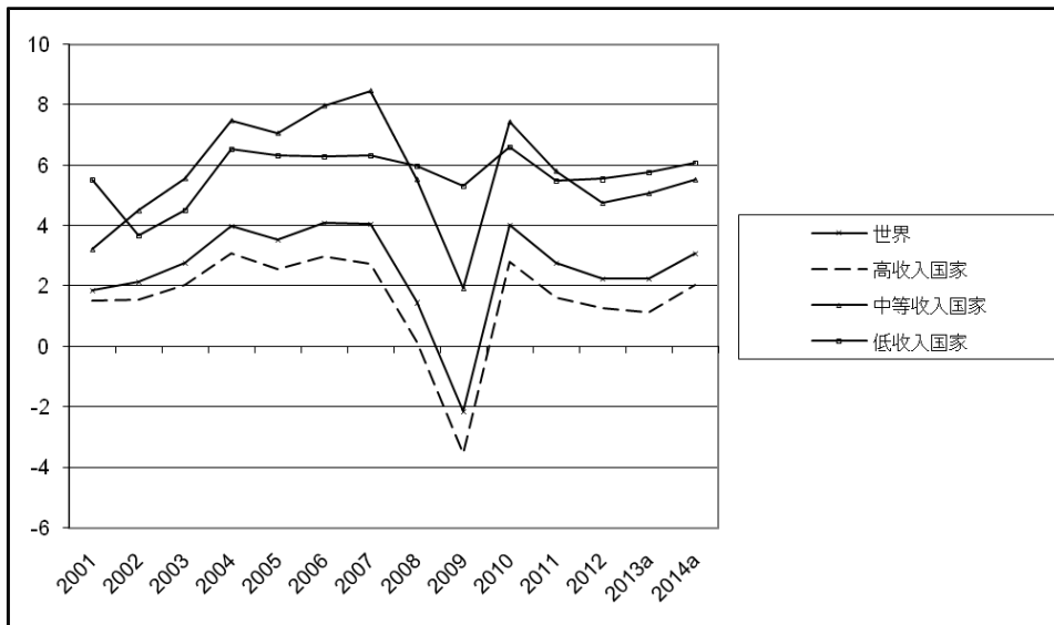
图一 不同类别国家年度实际 GDP 增长率(百分比变化)