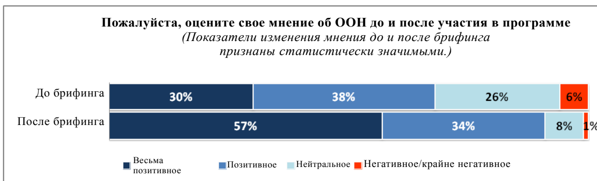
Диаграмма II Динамика мнений об Организации Объединенных Наций среди участников брифингов информационных центров Организации Объединенных Наций

Примечание: Составлено по результатам опроса 3088 человек в 41 информационном центре Организации Объединенных Наций.