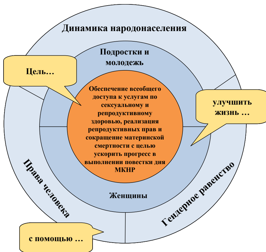
Диаграмма 1 Яблочко мишени

7. Яблочко мишени указывает цель ЮНФПА: обеспечение всеобщего доступа к услугам по сексуальному и репродуктивному здоровью, реализация репродуктивных прав и сокращение материнской смертности. Работа организации направлена на достижение этой цели, в первую очередь благодаря повышенному вниманию вопросам планирования семьи, охраны здоровья матери и ВИЧ/СПИДа. Достижение этой цели принесет большую пользу людям во всем мире благодаря ускорению прогресса в выполнении повестки дня Международной конференции по народонаселению и развитию и позволит внести огромный вклад в достижение целей в области развития, сформулированных в Декларации тысячелетия (ЦРДТ). Цель Декларации тысячелетия 5 а) и 5 b), касающаяся материнской смертности и репродуктивного здоровья, находится в центре внимания работы Фонда, однако при этом следует признать, что улучшение охраны здоровья матери имеет ряд более широких последствий для развития в контексте других ЦРДТ, например: