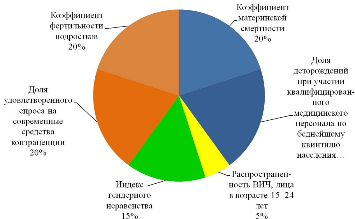
Диаграмма 5 Весовые коэффициенты по показателям

81. Взвешивание по компонентам показателей связано с бизнес-моделью, особенно в том, что касается признания, что способы действий Фонда могут варьироваться в зависимости от ситуации. Эти различные способы действий обуславливают количество присваиваемых баллов: поскольку ЮНФПА должен быть готовым к оказанию полного пакета услуг самым остро нуждающимся странам, страны в этом секторе получают максимальное количество баллов по тому или иному показателю. В странах с низкими потребностями ЮНФПА обычно концентрирует внимание на пропаганде и консультировании/диалоге по вопросам политики, в связи с чем количество присваиваемых стране баллов сокращается.