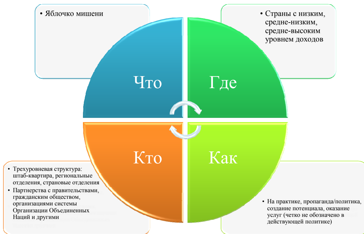
Диаграмма 4 Высокоуровневая схема нынешней бизнес-модели

41. Есть множество причин для пересмотра бизнес-модели, указанной в приложении 3. С этой целью в нее был внесен ряд изменений. Многие из них обусловлены необходимостью обеспечения большей ясности в отношении стратегий программирования, которые ЮНФПА следует применять в различных ситуациях, как показано в таблице 1.