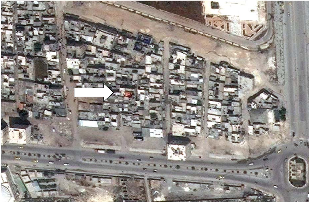
Digital Globe World View 1 – 13 May