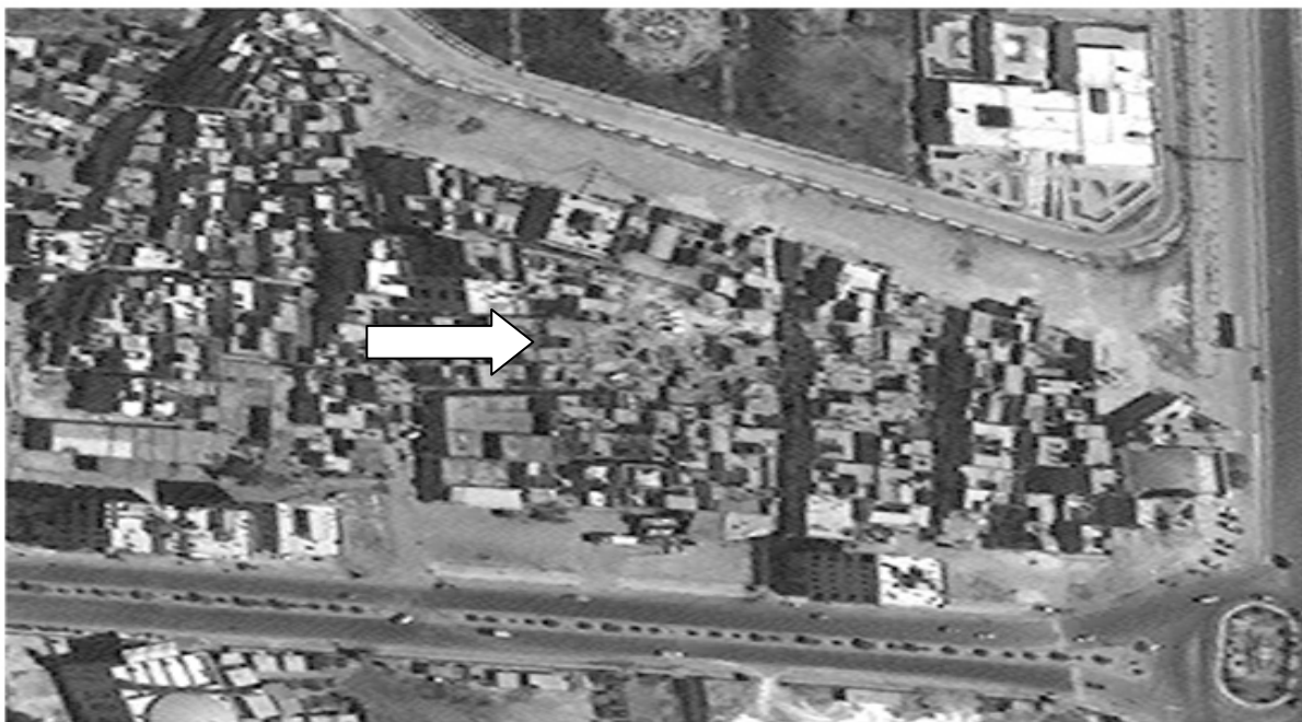
Digital Globe World View 1 – 27 July