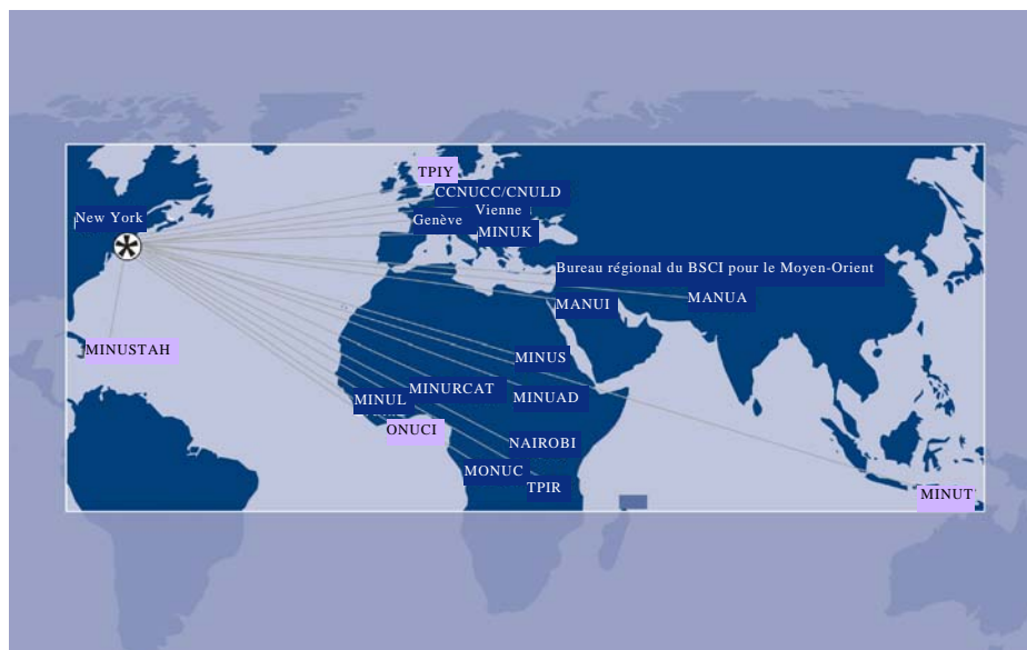
Figure I Bureaux du Bureau des services de contrôle interne

5. En 2009, le Service de l'audit des activités de maintien de la paix a remis 92 rapports aux directeurs de programme, dont 2 ont été soumis à l'Assemblée générale. Le tableau 1 ci-après en donne la répartition par domaine d'audit.