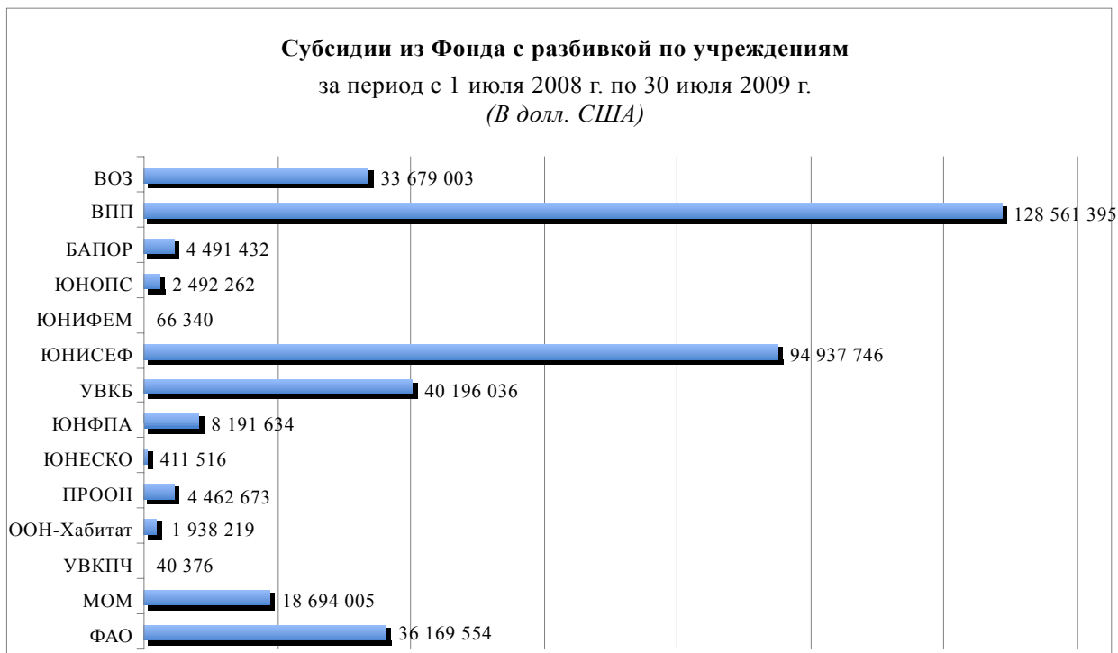
Рисунок П Субсидии из Центрального фонда реагирования на чрезвычайные ситуации с разбивкой по учреждениям

Примечание: Указанные суммы отражают финансирование проектов, согласованное Координатором чрезвычайной помощи, а не фактические объемы финансирования, утвержденные Организацией Объединенных Наций.