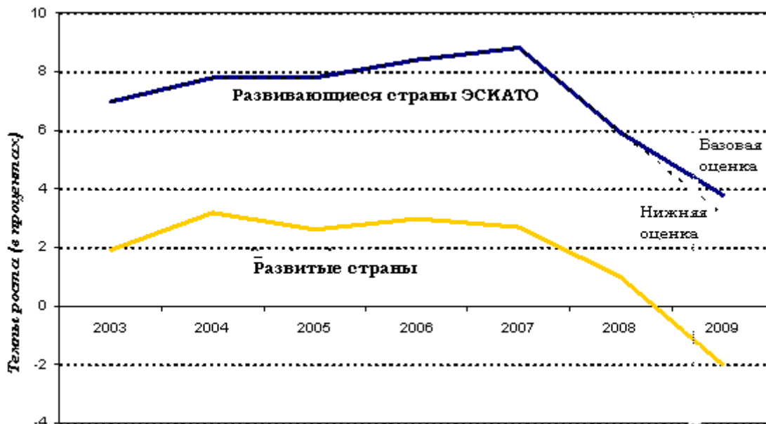
Диаграмма 1. Фактические темпы роста валового внутреннего продукта отдельных развивающихся стран ЭСКАТО и развитых стран, 2003-2009 годы

Источники: Подсчеты произведены на базе национальных источников; Международный валютный фонд, International Financial Statistics CD-ROM (Washington, D.C., November 2008); Азиатский банк развития, Key Indicators for Asia and the Pacific 2008 (Manila, 2008); данные Межгосударственного статистического комитета Содружества Независимых государств, получены с сайта www.cisstat.com 3 февраля 2009 года; и оценки и прогнозы ЭСКАТО. Данные по развитым странам взяты из базы данных World Development Indicators и обновленного прогноза Global Economic Prospects 2009 Всемирного банка (March 30, 2009).