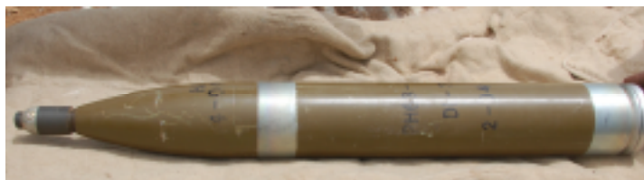
装配 MJ-1 近爆引信的 107 毫米火箭弹