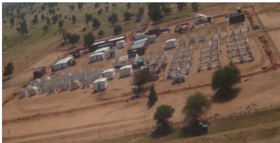
哈斯卡尼塔军事小组驻地遭到袭击后的鸟瞰图

313. 哈斯卡尼塔位于北达尔富尔东南部，距 Al Daein 约 85 公里，与科尔多凡州相邻。发生袭击时，军事小组驻地部署有 157 名工作人员，其中包括一个连的保护部队、军事观察员、民警和其它文职雇员。