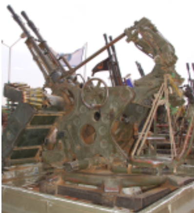
照片 24 双管高射炮