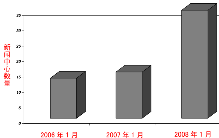
纪念大屠杀纪念日的新闻中心数量增加情况