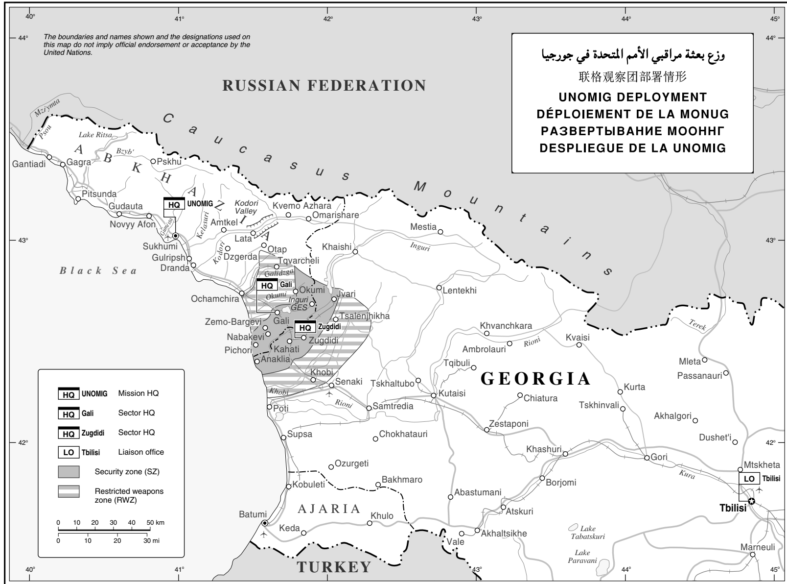
Map No. 3837 Rev. 56 UNITED NATIONS January 2008