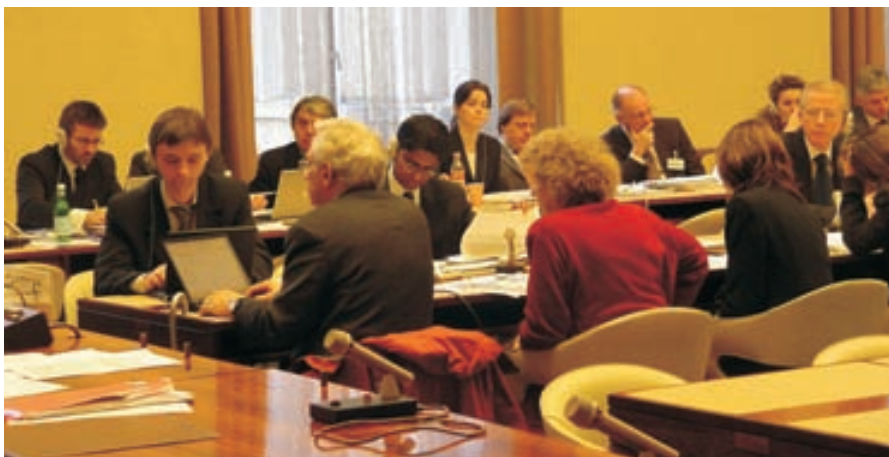
Встреча экспертов в Женеве, посвященная обсуждению задач предоставления доступа к правосудию в рамках Конвенции

Экологические права, поставленные под защиту Конвенции, должны соблюдаться «государственными органами», которые включают органы государственной власти всех отраслей и любого уровня – от местного до национального (за исключением законодательных и судебных органов), государственные или частные организации, исполняющие государственные административные функции или оказывающие услуги населению, например, предприятия-поставщики природного газа, предприятия электроснабжения и санитарно-технические службы, а также учреждения региональных организаций экономической интеграции, ставших Стороной Конвенции. Власти не должны подвергать наказанию, преследованиям или притеснениям в какой бы то ни было форме тех лиц, которые пользуются своими правами, определенными Конвенцией.