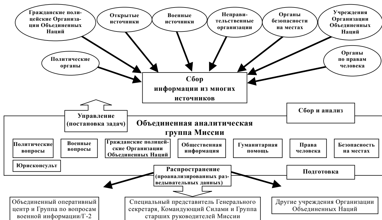
Диаграмма 3 Рабочий процесс в multidисциплинарной Объединенной аналитической группе Миссии

ных вопросов, таких как экология или частная собственность. На диаграмме 3, ниже, показано, каким образом должна функционировать в полном объеме многосторонняя ОАГМ. Такая рабочая архитектура позволяет уделять основное внимание обеспечению комплексного стратегического анализа, а также распространению проанализированных разведывательных данных, получаемых из многих источников, среди всех компонентов миссии, что позволяет всем компонентам сосредоточивать свои усилия на решении главных, а не частных задач миссии.