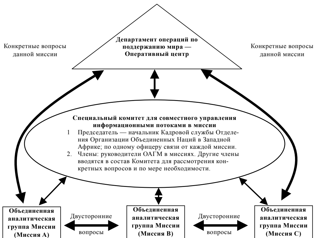
Диаграмма 6 Предлагаемая архитектура для обмена информацией между миссиями (пример для Отделения Организации Объединенных Наций в Западной Африке)

31. Однако УСВН отметило, что не во всех регионах есть такие региональные отделения, как Отделение Организации Объединенных Наций в Западной Африке, поэтому создание региональной ОАГМ, как показано на диаграмме 6, в таких регионах может быть даже контрпродуктивным, поскольку будет создана структура, содействующая принятию решений, но при этом у нее не будет никаких полномочий на принятие решений. Так как каждая миссия полностью уполномочена принимать касающиеся ее решения и обязана лишь должным образом учитывать последствия региональных событий для ее деятельности, эту задачу можно эффективно решить с помощью обмена докладами и анализа данных и, возможно, с помощью обмена офицерами связи. Функции, которые выполняет Отделение Организации Объединенных Наций в Западной Африке, вполне может взять на себя Департамент операций по поддержанию мира, расположенный в Центральном учреждении, если будет создан соответствующий потенциал в Оперативном центре или в Службе текущих военных операций в целях информационного обеспечения таких миссий без создания регионально-го координационного центра.