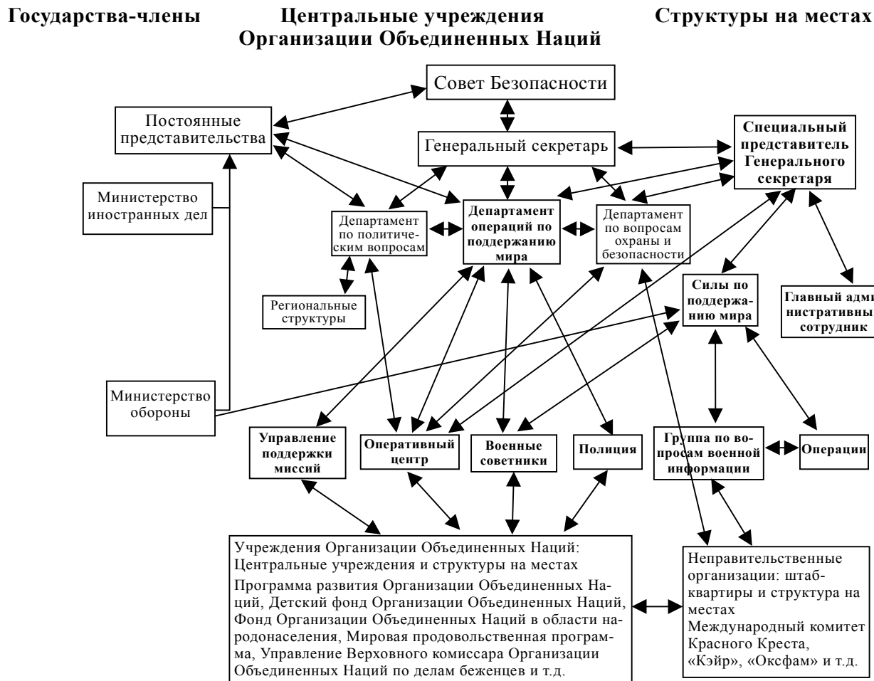
Диаграмма 1 Основные действующие лица и информационные потоки в ходе операций по поддержанию мира