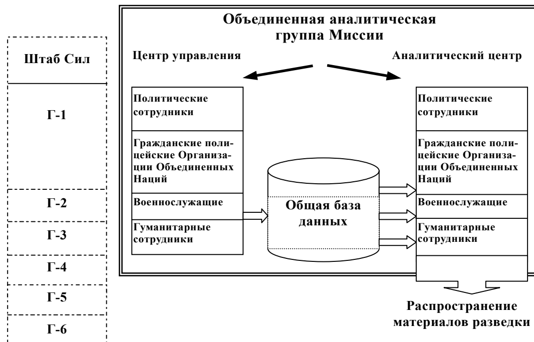
Схема отношений между Объединенной аналитической группой Миссии и Группой по вопросам военной информации