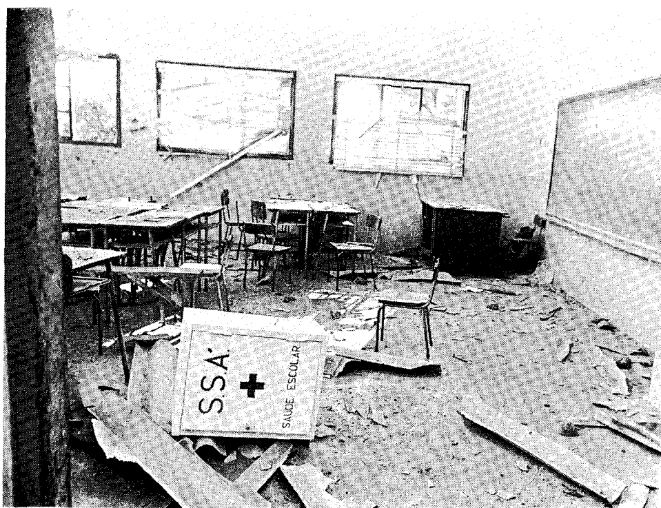
Разрушенная агрессорами Смита школа.