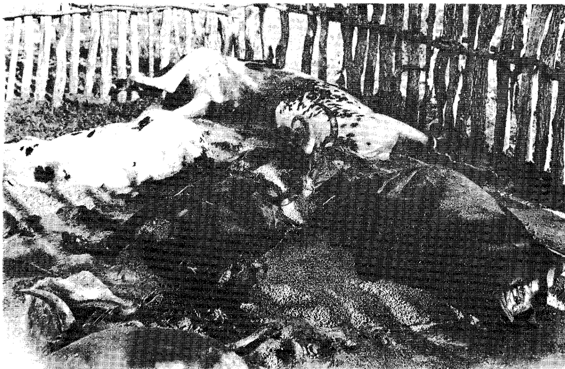
Сотни голов скота были злонамеренно уничтожены в загонах расистскими войсками Смита.