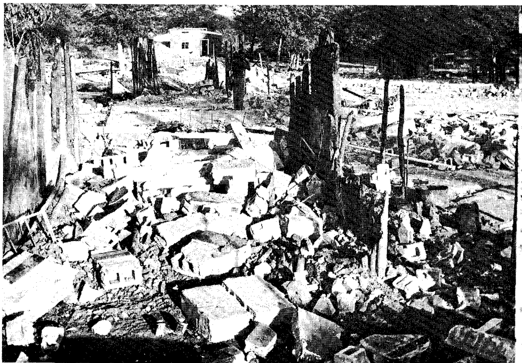
Город Мапай был полностью разрушен родезийскими войсками