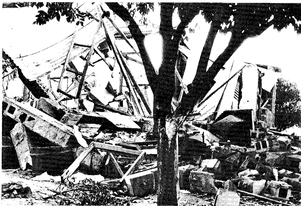
Груда развалин и кирпичей - вот что осталось от здания, в котором размещалось почтовое отделение