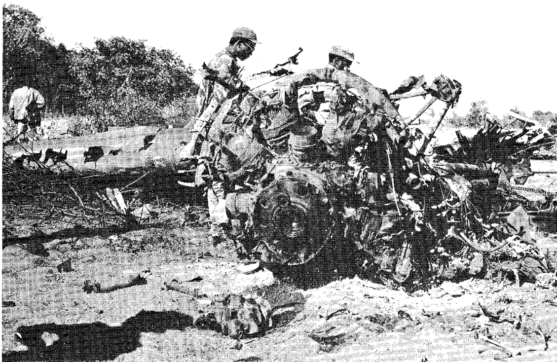
Обломки родезийского самолета "Дакота", который взорвался и загорелся после того, как при взлете его сбили Народные силы освобождения Мозамбика. Пятнадцать солдат Смита были убиты.