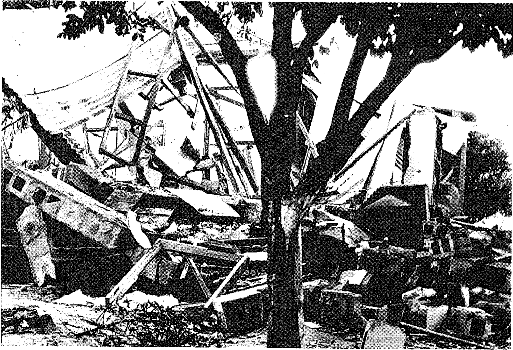
Este montón de escombros y ladrillos era el edificio donde funcionaba la Oficina de Correos.