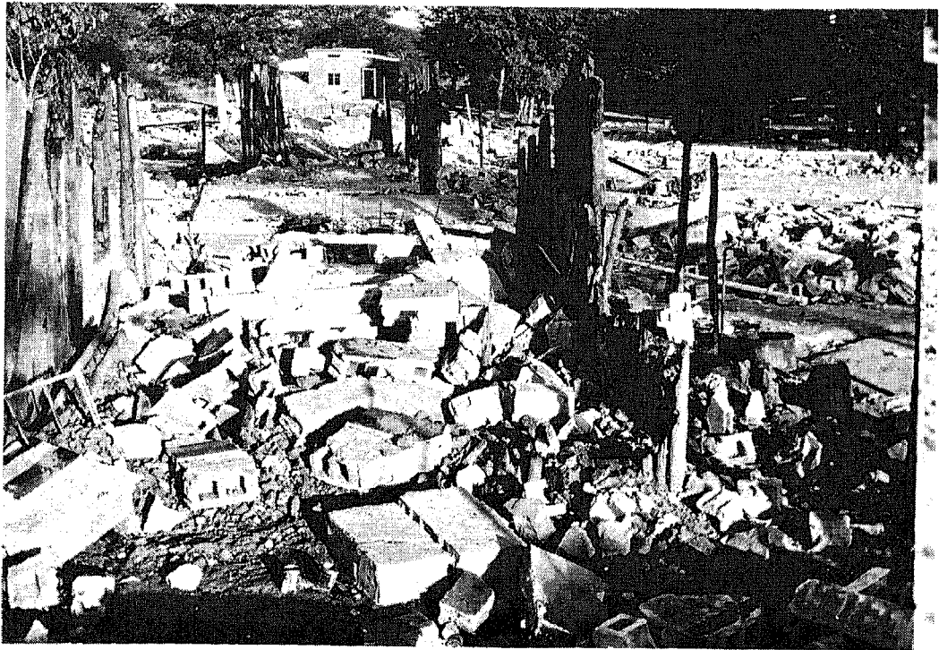
La ciudad de Mapai fue totalmente destruida por las tropas de Rhodesia.