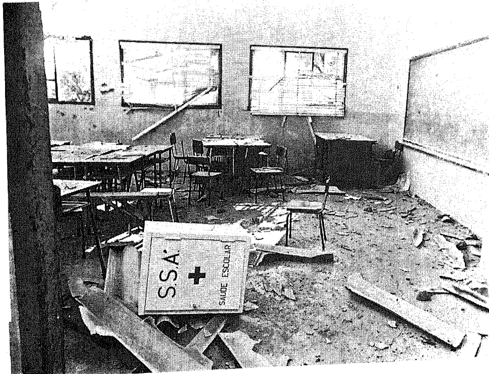
Una escuela fue destruida por los agresores de Smith.