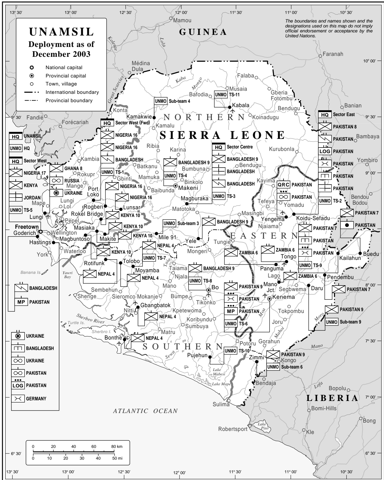
Map No. 4132 Rev. 25 UNITED NATIONS December 2003 (Special)

Department of Public Information Cartographic Section