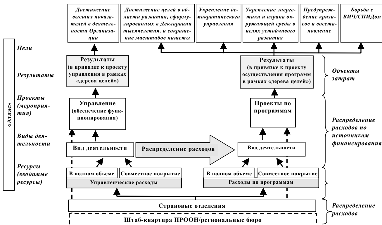
Рис. 2 Распределение расходов

26. Процесс распределения расходов по источникам финансирования варьируется в зависимости от категории управленческих расходов. Так, расходы на руководителя программы, обеспечивающего осуществление трех конкретных программ, действительно можно было бы распределить на основе анализа временных затрат. Расходы организации на системную поддержку можно было бы возмещать путем взимания с пользователей фиксированной ежегодной платы. А расходы на помещения можно было бы распределять между всеми программами исходя из процентных долей занимаемой каждой из них площади. Во всех этих примерах важнейшим элементом является то, что метод распределения расходов по источникам финансирования опирается на четкие причинно-следственные связи, а также является простым и достаточно точным.