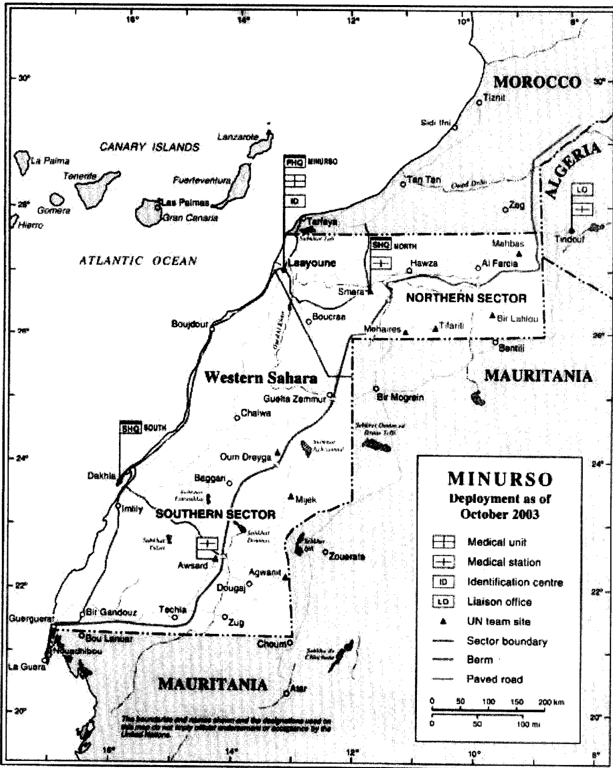
Map No. 3681 Rev. 42 UNITED NATIONS October 2003

Department of Public Information Cartographic Section