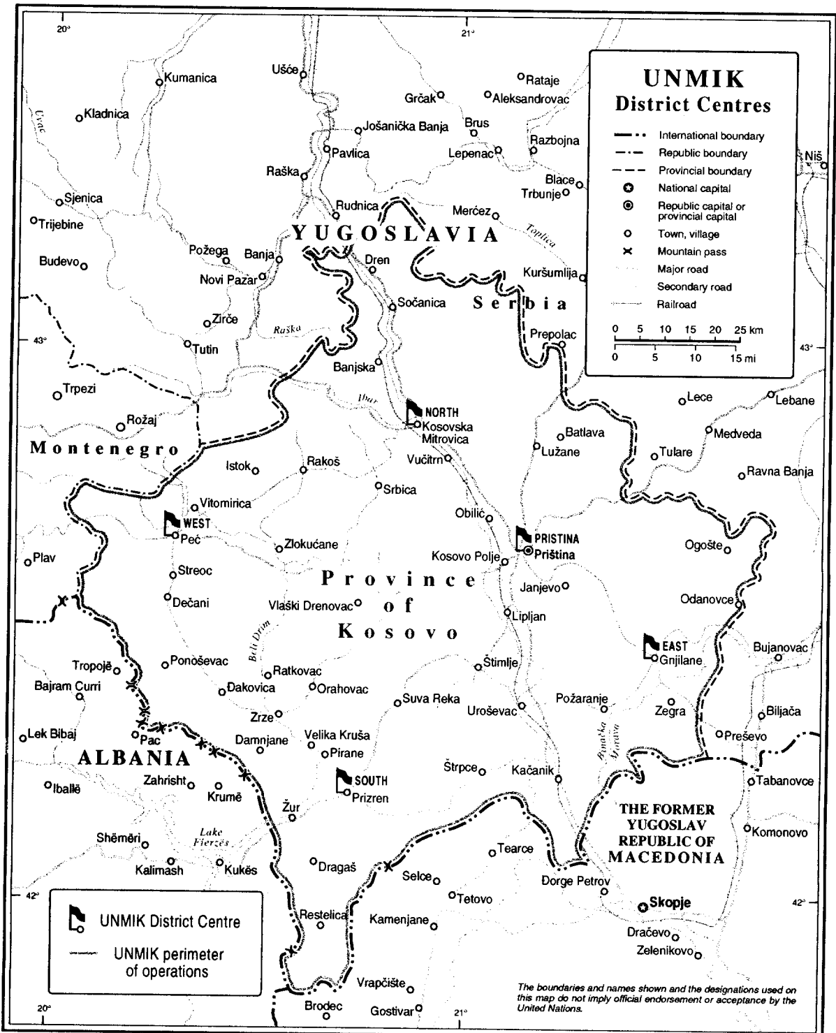
Map No. 4133 Rev. 8 UNITED NATIONS October 2002 (Special)

Department of Public Information Cartographic Section