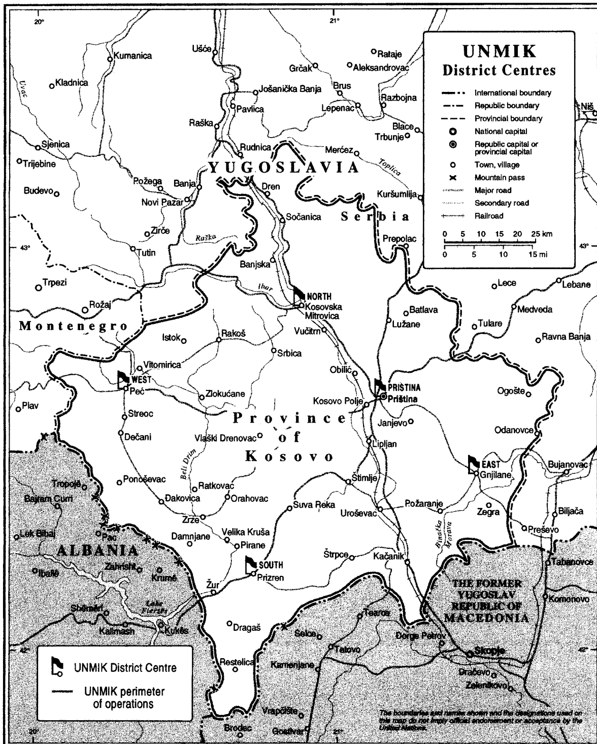
Map No. 4133 Rev. 8 UNITED NATIONS October 2002 (Special)

Department of Public Information Cartographic Section