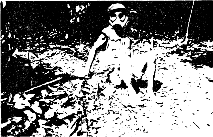
被民主柬埔寨国民军在马 德望省拜林前线俘获的戴 着防毒面具的越南士兵 (1983年1月12-13日)