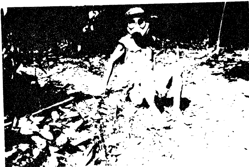
Вьетнамский солдат в противогазе, захваченный в плен национальной армией Демократической Кампучии в ходе боевых действий в Пайлине, провинция Баттамбанг (12-13 января 1983 года)