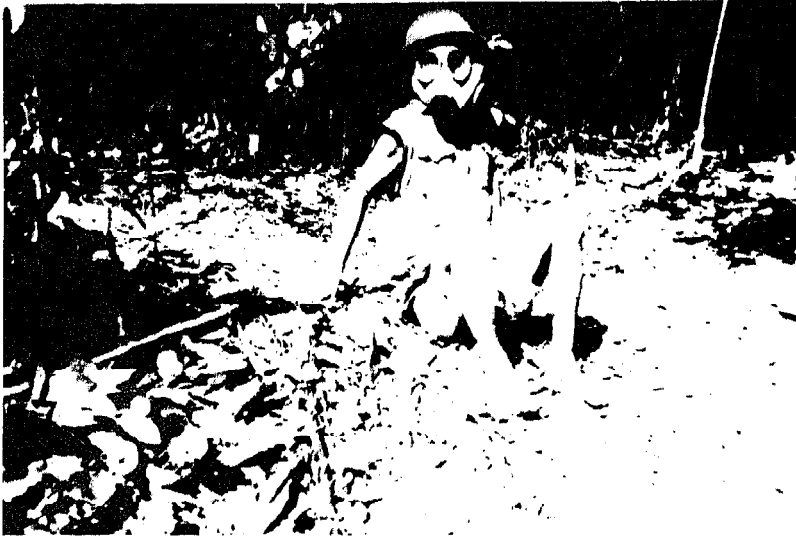
Un soldat vietnamien portant un masque à gaz capturé par l'Armée Nationale du Kampuchea Démocratique sur le front de Pailin dans la province de Battambang (12-13 janvier 1983).