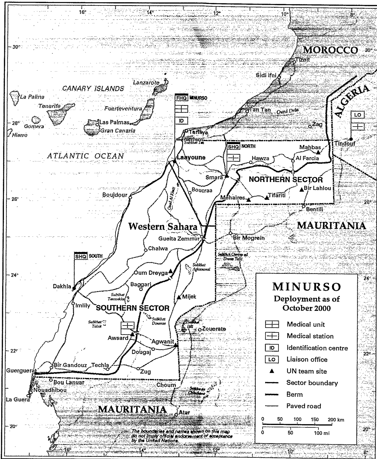
Map No. 3881 Rev. 30 UNITED NATIONS October 2000 (Special)

Department of Public Information Cartographic Section