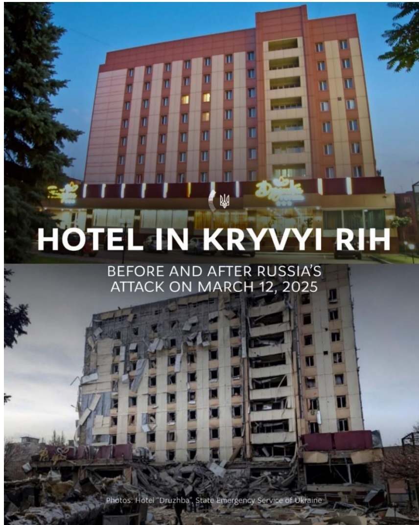
Hotel en Kryvyi Rih, antes y después del ataque de Rusia del 12 de marzo de 2025.