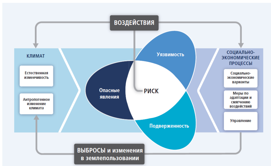
Рисунок 3. Иллюстрация основных концепций вклада Рабочей группы II в Пятый доклад об оценке Межправительственной группы экспертов по изменению климата

Примечание. Риск связанных с климатом воздействий возникает в результате взаимодействия между связанными с климатом опасностями (включая опасные явления и тенденции) и уязвимостью и подверженностью антропогенных и естественных систем. Изменения как в климатической системе (слева), так и в социально-экономических процессах, включая адаптацию и смягчение воздействия (справа) являются основными факторами опасности, подверженности и уязвимости (Межправительственная группа экспертов по изменению климата, Изменение климата 2014: Воздействие, адаптация и уязвимость , 2014 г.).