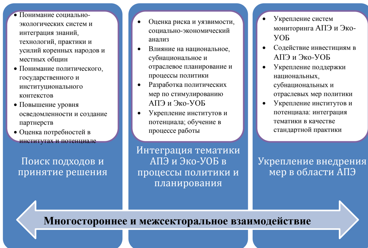
Рисунок 1. Пример структуры для включения мер по АПЭ и Эко-УОБ в планирование развития

Примечание: Адаптировано из публикаций: Operational Framework for Ecosystem-based Adaptation: Implementing and Mainstreaming Ecosystem-based Adaptation Responses in the Greater Mekong Sub-Region (Операционные рамки для экосистемной адаптации: внедрение и актуализация мер экосистемной адаптации в субрегионе Большого Меконга), Всемирный фонд дикой природы (2013 г.); и Mainstreaming Climate Change Adaptation into Development Planning: A Guide for Practitioners (Интеграция тематики адаптации к изменению климата в планировании развития: руководство для практиков), ПРООН-ЮНЕП (2011 г.).