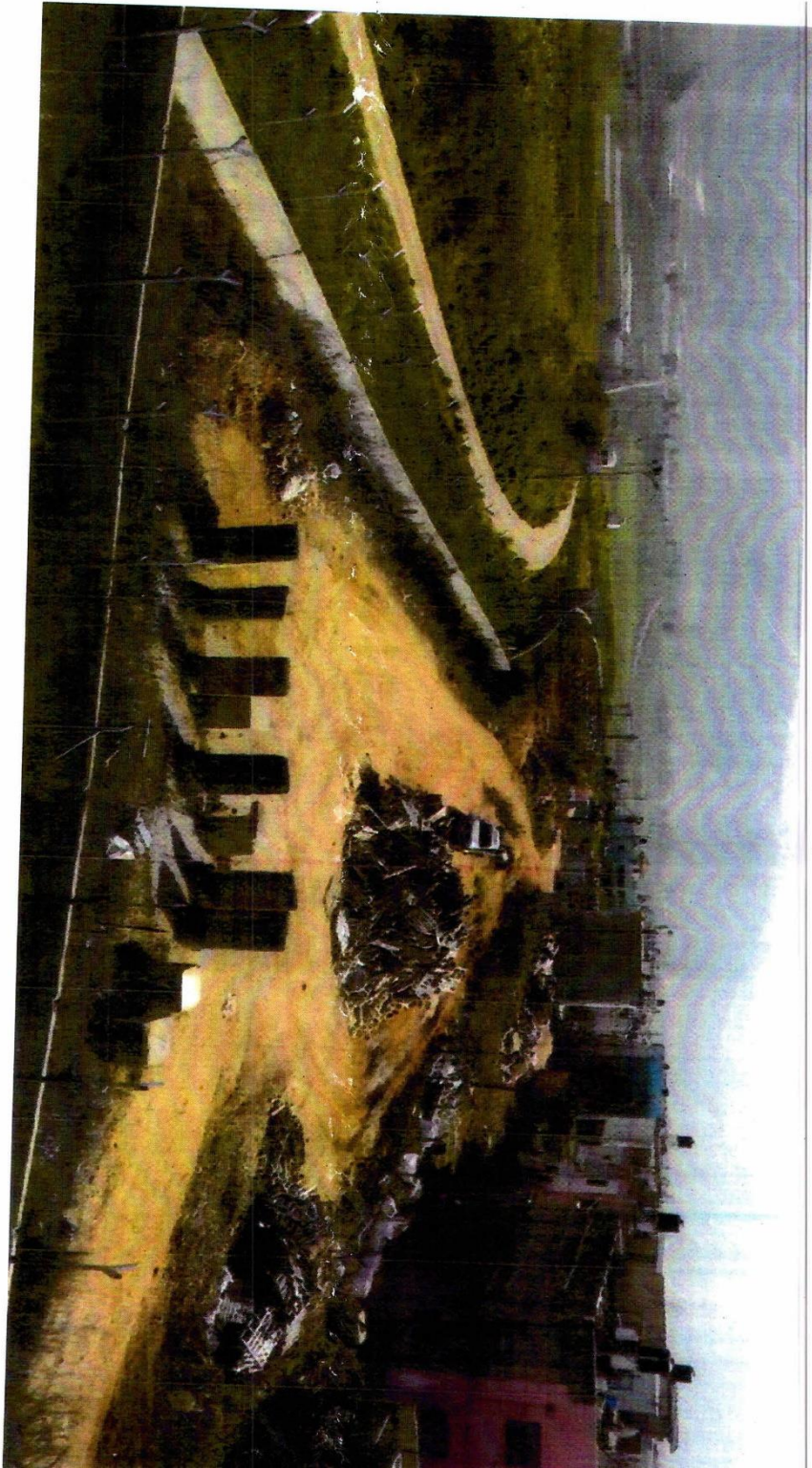
مشهد للساح بعد تشييده