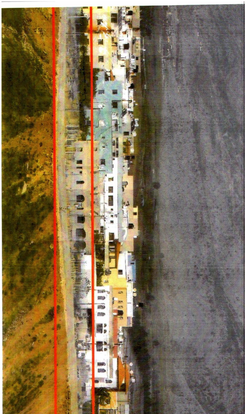
مشهد للساحح بعد تشييده