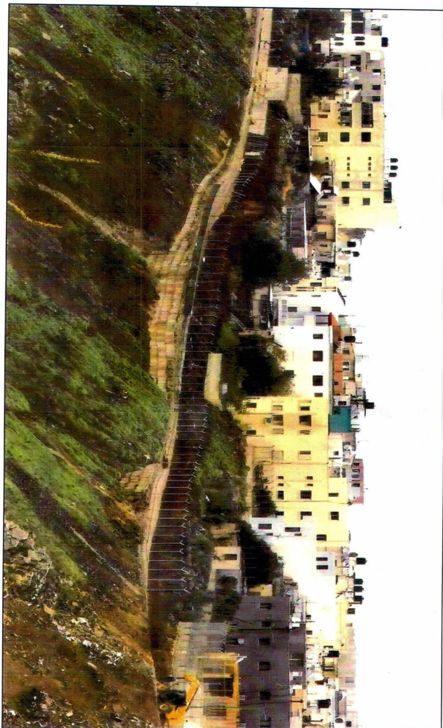
صورة خلال مرحلة بناء السياج المعنني الجديد حول البلدة