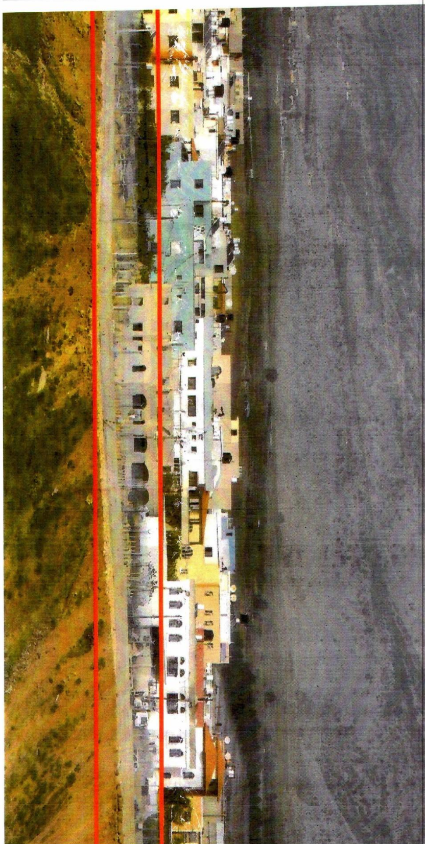
مشهد للسياج بعد تشييده