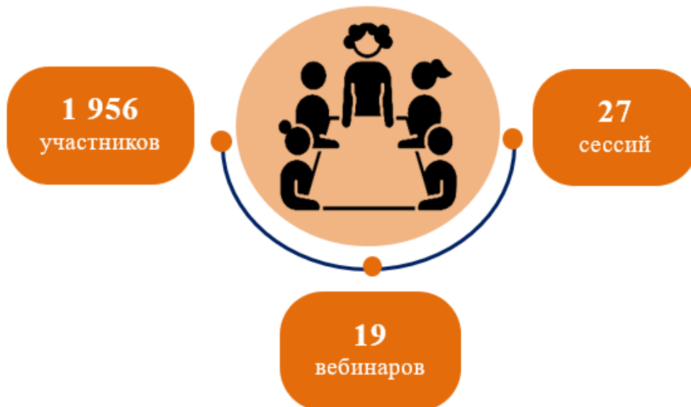
Рисунок III Охват учебных мероприятий в 2022 году