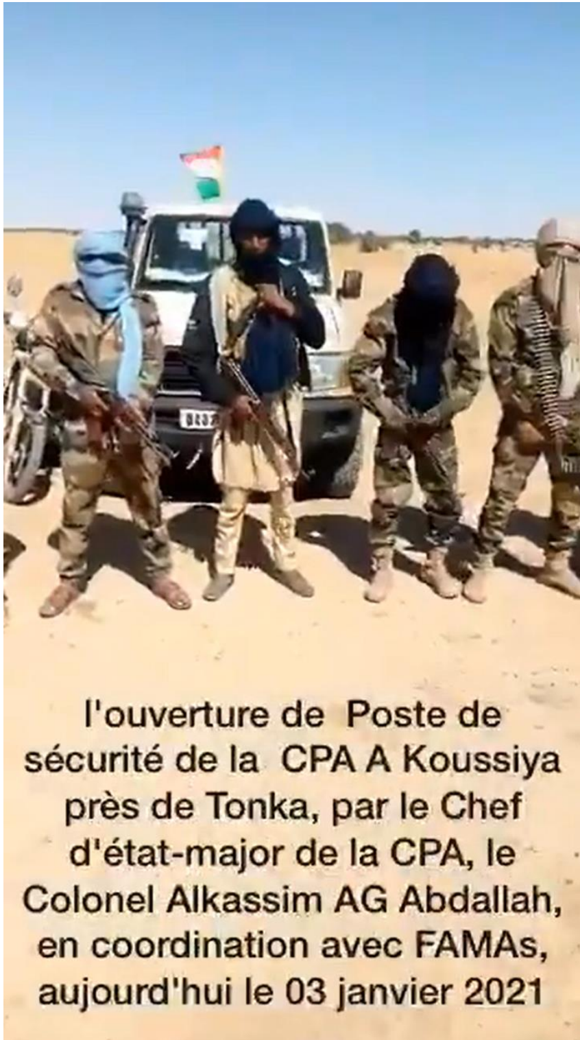
Snapshot from a video announcing the establishment of security posts near Tonka 5