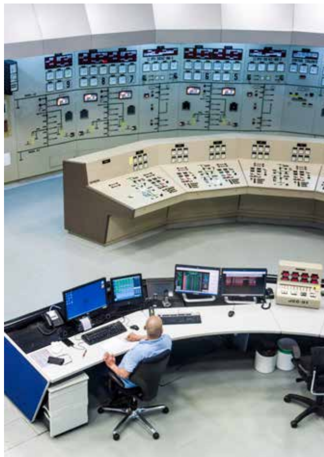
Sala de mandos de la planta de energía hidroeléctrica

Con vistas a promover el crecimiento económico, la reducción de la pobreza y la sostenibilidad ambiental, hay que prestar atención a los métodos para paliar la pérdida de puestos de trabajo o el desplazamiento, y aumentar al máximo la creación de empleo que puede resultar de la puesta en práctica de un enfoque integrado de la gestión del agua.