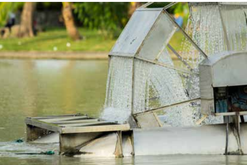
Turbine hydraulique de Chaipattana, dans un parc public en Thaïlande

La demanda de energía está aumentando, en particular la demanda de electricidad en las economías emergentes y en los países en desarrollo. El sector energético, con la extracción de agua en aumento, que en la actualidad representa alrededor del 15% del total mundial, proporciona empleo directo. La producción de energía como requisito para el desarrollo hace posible la creación directa e indirecta de puestos de trabajo en todos los sectores de la economía. El crecimiento en el sector de las energías renovables conduce a un aumento del número de puestos de trabajo verdes y no dependientes del agua.