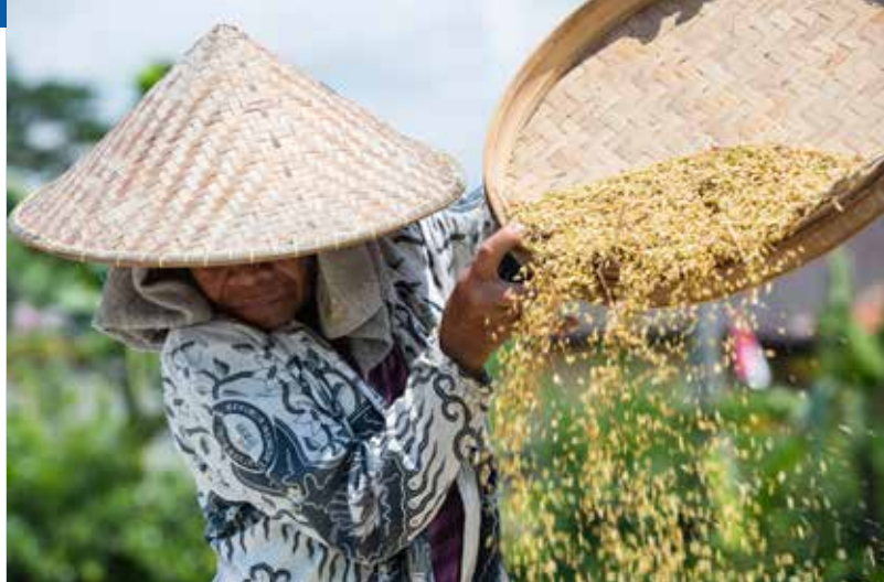
Riziculteur à Ubud, sur l'île de Bali, en Indonésie

Resumiendo, el 78% de los puestos de trabajo que constituyen la mano de obra mundial dependen del agua.