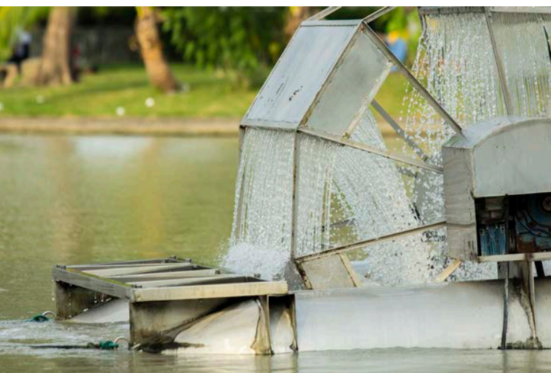
泰国公园中的查巴塔那水轮机

对能源的需求在增加，发展中国家和新兴国家对电力的需求尤为突出。能源行业的采水量在增加，目前已占全世界耗水量的15%，直接创造了就业。能源生产对发展必不可少，为各行各业直接或间接创造了就业。可再生能源行业的发展使绿色的、不依赖水的行业的就业机会增加。