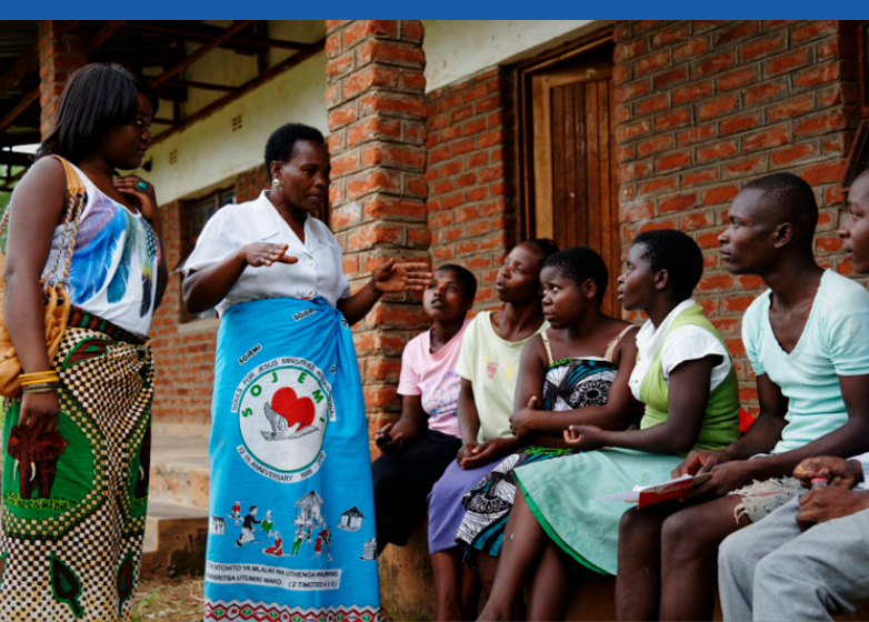
社区工作者讨论会