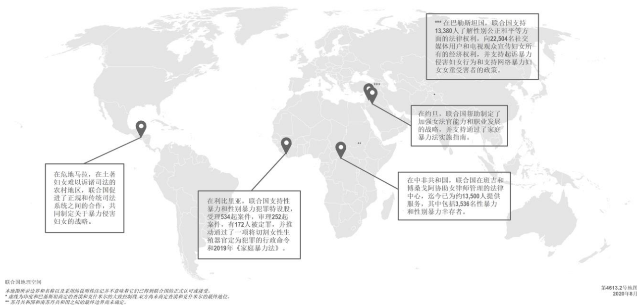
图四 联合国提供援助支持妇女和女童的实例