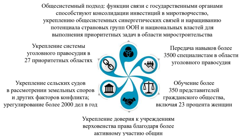
Рисунок VI Поддержка Организации Объединенных Наций для содействия переходному процессу в Дарфуре путем укрепления верховенства права в целях предотвращения конфликтов и поддержания мира

71. Верховенство права способствует достижению и поддержанию мира. Участие Фонда миростроительства способствовало повышению согласованности инициатив в области правосудия переходного периода в рамках системы Организации Объединенных Наций на основе задействования сравнительных преимуществ каждой структуры. Результаты недавно проведенного тематического обзора поддержки, оказанной Фондом миростроительства 22 инициативам в области правосудия переходного периода в 11 странах, подчеркивают важность совместного анализа и планирования для выработки согласованного и действенного подхода.