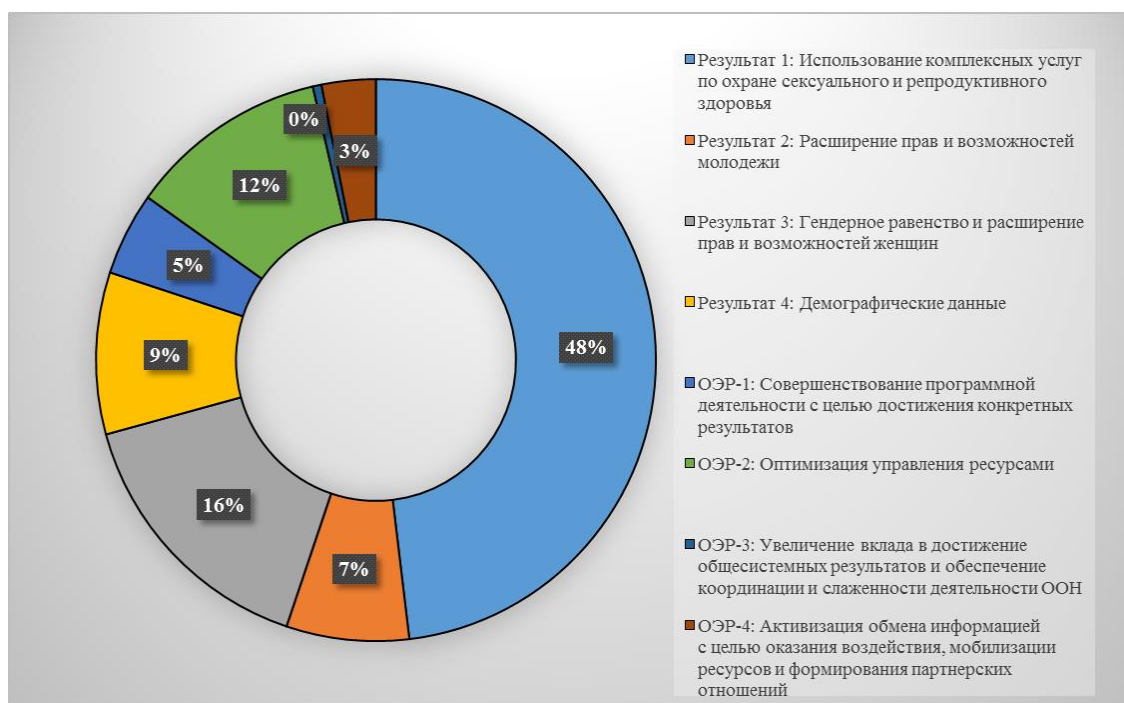
Диаграмма 3. Ориентировочные ассигнования в разбивке по результатам и задачам в период 2018–2021 годов — пересмотренные

50. На диаграмме 3, приведенной ниже, отражено твердое намерение Фонда направлять преобладающую часть общего объема своих ресурсов на достижение результатов в области развития (80 процентов от общего объема). Приблизительно 48 процентов от общего объема ресурсов направляется на достижение результата 1, что отражает неизменную приверженность концепции «прямого попадания», то есть стратегической направленности, которая была вновь подтверждена в Стратегическом плане ЮНФПА на 2018–2021 годы.