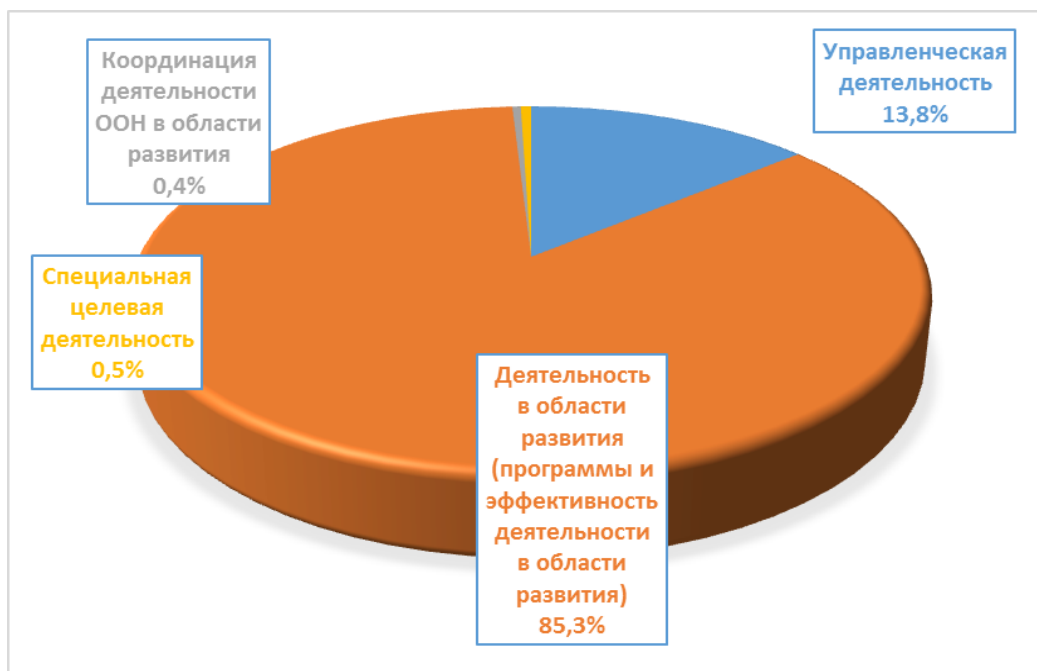
Диаграмма 2. Распределение имеющихся ресурсов в период 2018–2021 годов — пересмотренное

19. ЮНФПА продолжает направлять основную часть своих ресурсов на деятельность в области развития. Согласно прогнозным значениям, приведенным в среднесрочном обзоре на 2018–2021 годы, на деятельность в области развития ЮНФПА выделит 85,3 процента от общего объема имеющихся ресурсов, что превышает показатель 84,9 процента, который был запланирован в пересмотренном бюджете на 2018–2021 годы.