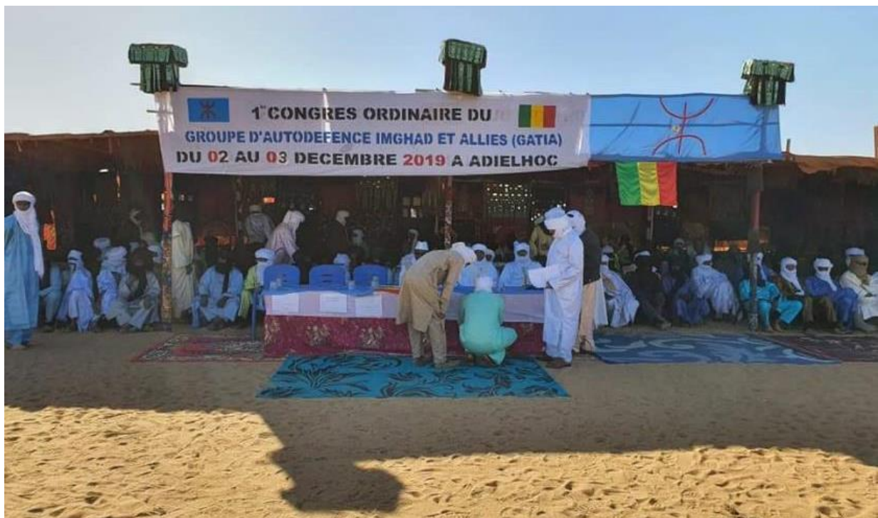
Photograph of the venue of the GATIA convention in Aguelhok (Adjelhoc)

11. On the other side of the spectrum, on 29-30 November 2019, the Conseil Supérieur des Imghads et Alliés (CSIA) presided by General Gamou organised its congress in Aguelhok, during which the latter was renewed as President. The GATIA held its first regular convention at the same location on 2-3 December 2019 by its secretary general, Fahad Ag Almahmoud, who also presides the Plateforme. The GATIA convention was attended in large numbers by the MSA-D, which came with 30 vehicles and about 200 combattants, and a MAA-Plateforme delegation from Timbuktu led by Moulaye Ahmed Ould Moulaye. A military parade with about 70 vehicles took place.