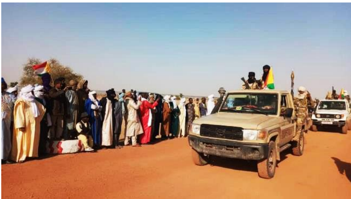
Military parade of vehicles at the CPA convention

14. The CPA of sanctioned individual Mohamed Ousmane Ag Mohamedoune (MLi.003), organised its own congress from 18 to 20 January 2020 in Soumpi, in presence of another sanctioned individual, Houka Houka Ag Alhousseini (MLi.005). A military parade was also organised and included some vehicles from the MSA-Chamanamas from Gao.