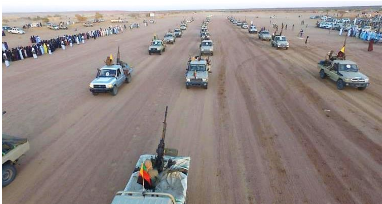
About 110 vehicles participated in the military parade of the MNLA

6. The military parade of the MNLA included more than 110 pick-up trucks and around 700 fighters, contradicting previous analysis of MNLA's military weakness compared to HCUA. A drone made an aerial footage of the parade and propaganda video clips were largely disseminated.