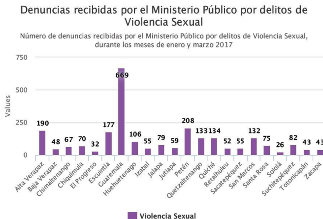
Gráfico 1 Denuncias recibidas por el Ministerio Público por delitos de Violencia Sexual. Enero-marzo 2017