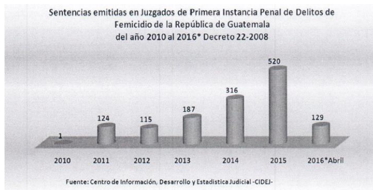
Gráfico 3 Sentencias en Delitos de Femicidio emitidas por Juzgados de Primera Instancia Penal Años 2010-2016

Información brindada por el Organismo Judicial.