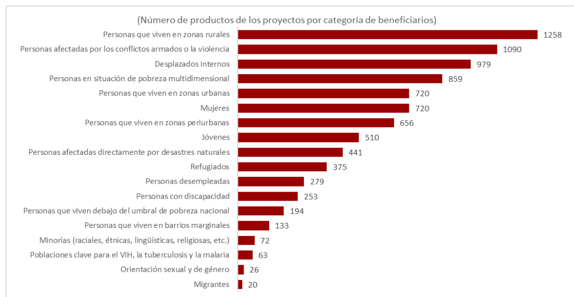
Figura 2 Grupos a los que están orientados los proyectos: no dejar a nadie atrás en los PMA

30. La estrategia del PNUD para la erradicación de la pobreza se regirá por la ventaja comparativa, la experiencia, los conocimientos especializados y las prioridades de la organización, y se ampliará, de un enfoque en favor de los pobres, a un enfoque inclusivo del desarrollo. De conformidad con el Plan Estratégico, el PNUD está elaborando un planteamiento común de la erradicación de la pobreza basado en los principales factores que la impulsan, sin dejar de reconocer que las esferas de intervención serán específicas para el contexto de cada país. Para ello se tendrán en cuenta los desafíos que los PMA tienen en común y que son exclusivos de ellos. Los resultados del “indicador PMA para no dejar a nadie atrás” se utilizarán para determinar si los esfuerzos se están dirigiendo correctamente a los grupos más excluidos. Si bien la medición de la pobreza es un punto fuerte del PNUD, el planteamiento de la reducción de la pobreza debe hacer hincapié en la economía y la economía política de ese fenómeno y en el modo en que las iniciativas del PNUD pueden ser un instrumento eficaz para que los Gobiernos modifiquen los factores determinantes de la pobreza.