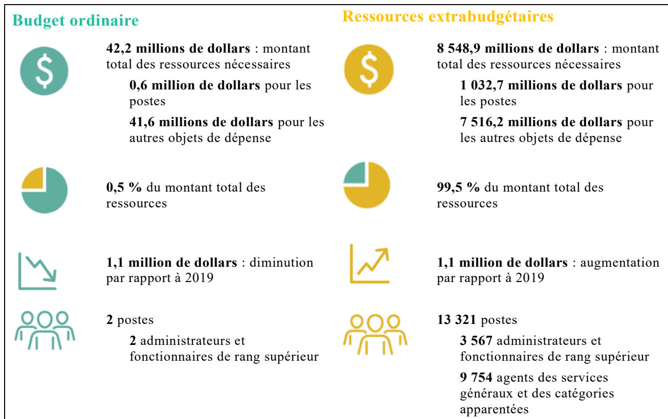
Figure 25.I 2020 en chiffres

25.22 On trouvera dans la figure 25.I et le tableau 25.2 des informations sur les ressources financières et les postes nécessaires pour 2020, répartis entre le budget ordinaire et les ressources extrabudgétaires qu'il est prévu de recevoir.