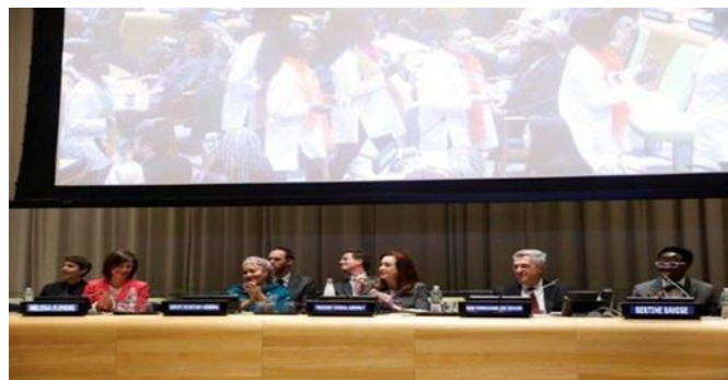
Accord historique en faveur des réfugiés : la Présidente de l'Assemblée générale invite les États Membres à intensifier leur action et à trouver des solutions.

En 2018, le Haut-Commissariat s'est attaché à assurer la protection de 71,4 millions de réfugiés, de personnes déplacées, de rapatriés et d'apatrides et à trouver des solutions à la situation dramatique dans laquelle ils se trouvent. Le travail comportait de multiples facettes et portait sur l'élaboration de cadres juridiques, la fourniture de secours vitaux et l'application, avec le concours des États et d'organisations, de stratégies globales. De nombreux réfugiés en quête de sécurité et de protection se heurtent à des pratiques qui sapent de plus en plus les fondements du droit d'asile et font face à des violences et à des actes d'exploitation pendant leur périple. En République démocratique du Congo, en Iraq et en République arabe syrienne, la population continue de fuir. Des crises, comme celles qui frappent l'Afghanistan ou la Somalie, durent depuis des dizaines d'années et continuent de jeter des centaines de milliers de personnes sur les routes. Au Yémen, les deux tiers de la population ont besoin d'une aide humanitaire ; au Soudan du Sud, les déplacés représentent 25 % de la population et l'exode des réfugiés n'est toujours pas endigué.