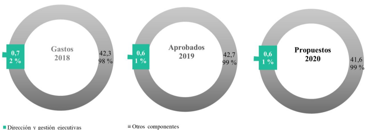
Cuadro 25.6 Dirección y gestión ejecutivas: evolución de los recursos financieros y humanos

(En millones de dólares de los Estados Unidos)