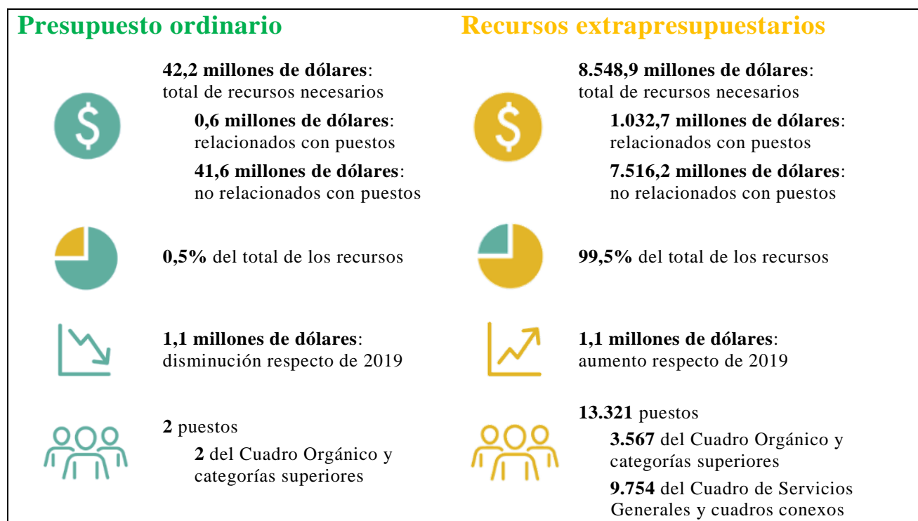
Figura 25.I 2020 en cifras

25.22 El total de recursos necesarios para 2020, que incluye los recursos del presupuesto ordinario y los recursos extrapresupuestarios previstos, se indica en la figura 25.I y en el cuadro 25.2